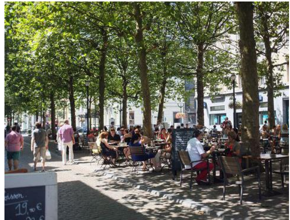
Sindsbillede på livet, der kan skabes på Krakas Plads

Det andet idéforslag handler om at revitalisere Krakas Plads. Krakas Plads er centralt placeret i boligområdet og bydelen. I dag er pladsen centrum for utryghedsskabende adfærd til gene for beboere i lokalområdet. Det skyldes blandt andet, at kvarteret er lukket for gennemkørsel og pladsen fungerer som opholdssted for parkerede biler med høj musik mv.