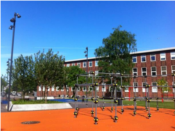
Krakas Plads i dag