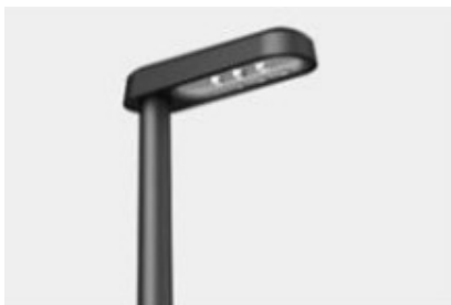
EW0 GO mast og armatur.

Ewo Go "kuffert" armatur med en 4 meter mast er valgt som princip for type af belysningsarmatur, der påtænkes anvendt på hele strækningen: