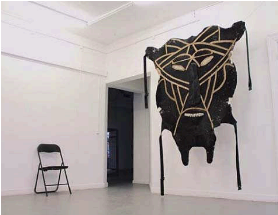
Martin Brandt Hansen. Grønlandsk maske af koskind

- gruppeudstilling med ung grønlandsk kunst