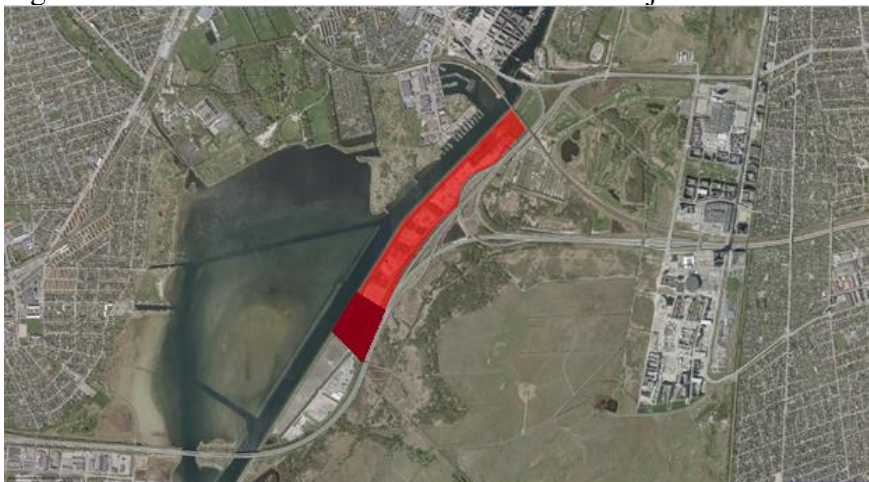
Fig. 1: Kort over det foreslåede areal ved Selinevej

Festivalpladsens konkrete udformning og størrelse vil i forbindelse med en foranalyse blive kvalificeret i dialog med diverse interessenter, Teknik- og Miljøforvaltningen og Amager Vest Lokaludvalg.