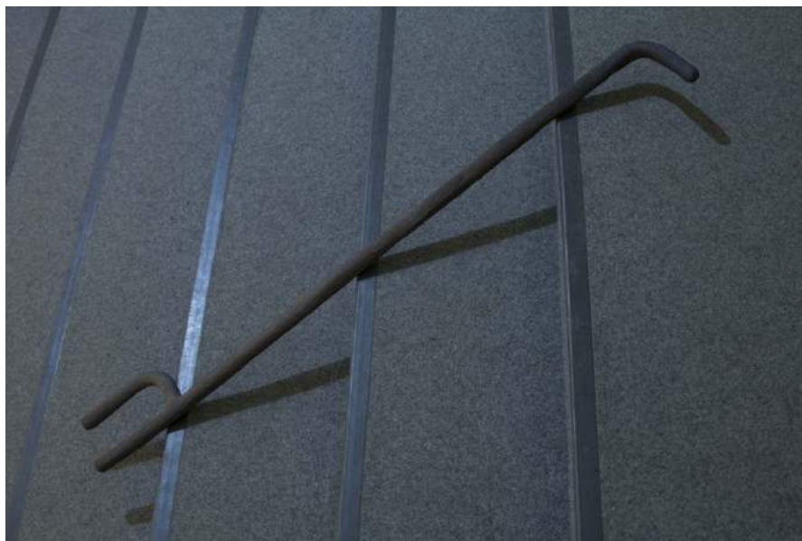
Louise Haugaard Jørgensen: Needs Transport Skin , 2016. Keramisk skulptur, 160 cm. Foto: Louise Haugaard Jørgensen