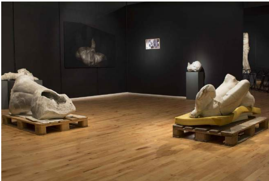
Louise Haugaard Jørgensen: Det Kinesiske Rum , 2016.

Portfolio (se flere billeder ved at klikke på ét af nedenstående)