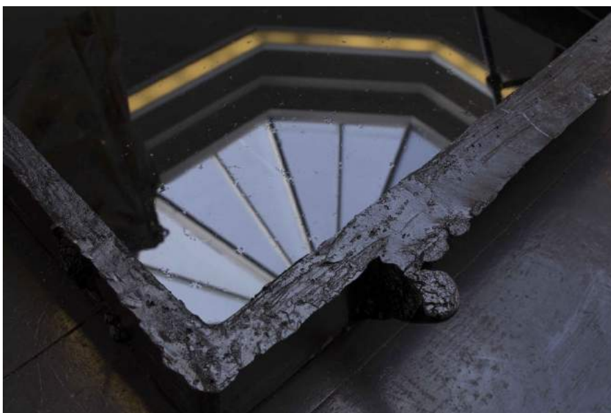
Louise Haugaard Jørgensen: Sejl/ have samler støv , 2017. Installation af skulpturelle elementer, variable dimensioner.