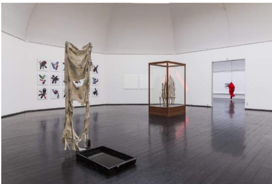
Louise Haugaard Jørgensen: Sejl/ have samler støv , 2017.

Installationsview, Antikmuseet i Aarhus.