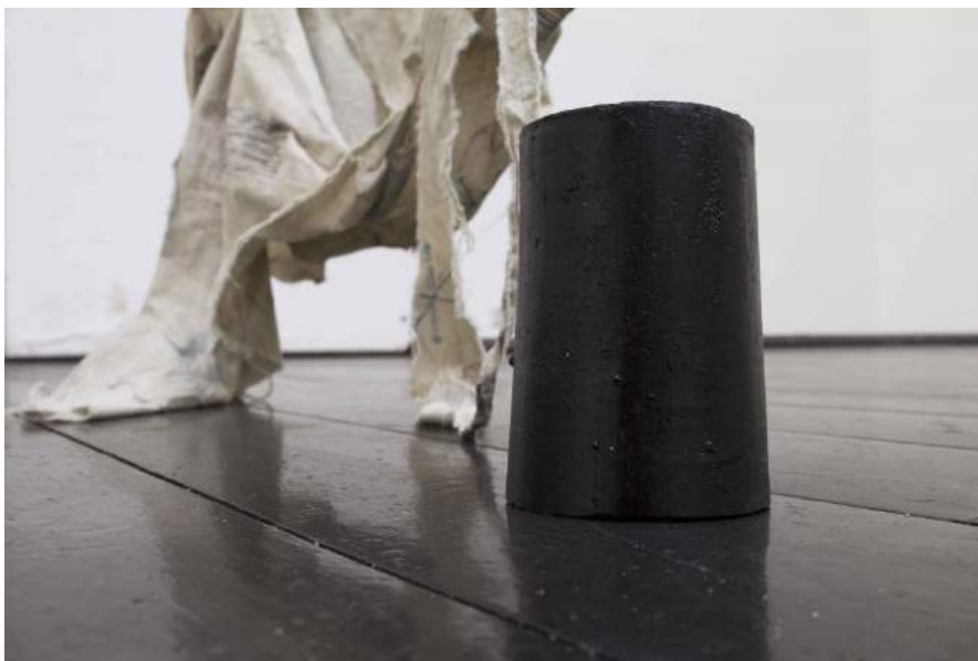
Louise Haugaard Jørgensen: Sejl/ have samler støv , 2017. Installation af skulpturelle elementer, variable dimensioner.