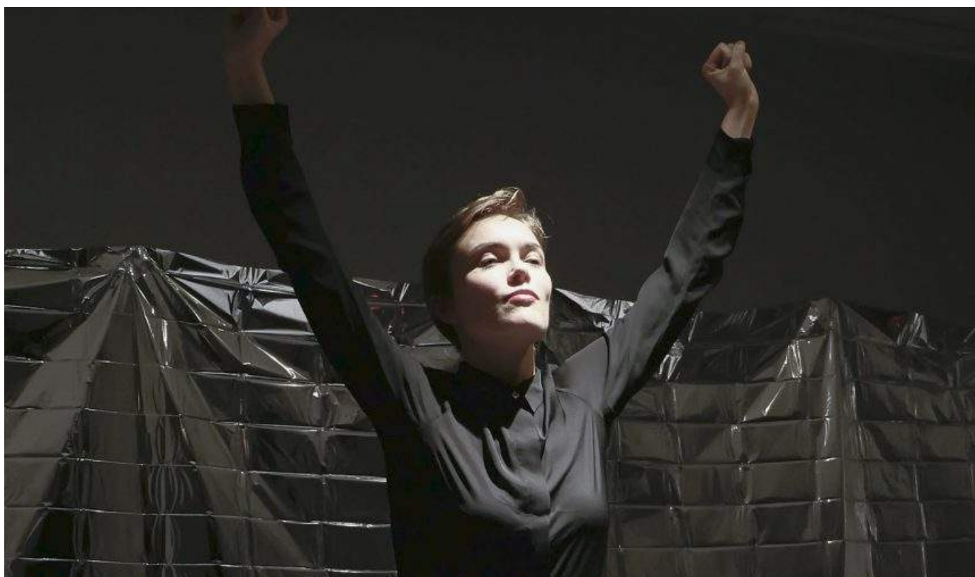
Louise Haugaard Jørgensen: Pros & Cons , 2016. Performance, varighed ca 13 min.

Ugens Kunstner 10 maj 2017 Af Nana Bendix Hansen