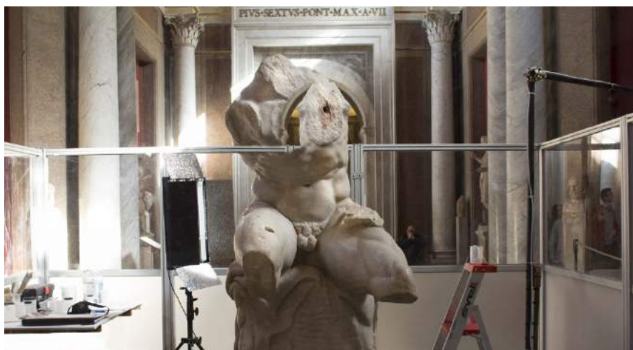
Louise Haugaard Jørgensen: Embryo Belvedere , 2016. Digital fotomanipulation, 49 x 26 centimeter.