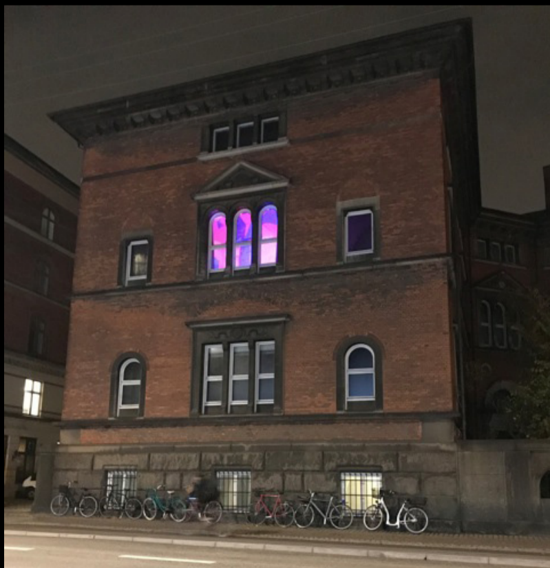
Idéskitse af koncept.