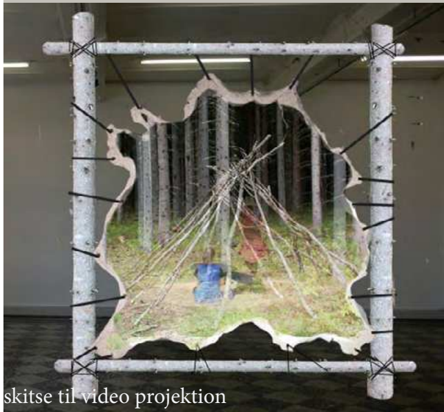
skitse til video projektion