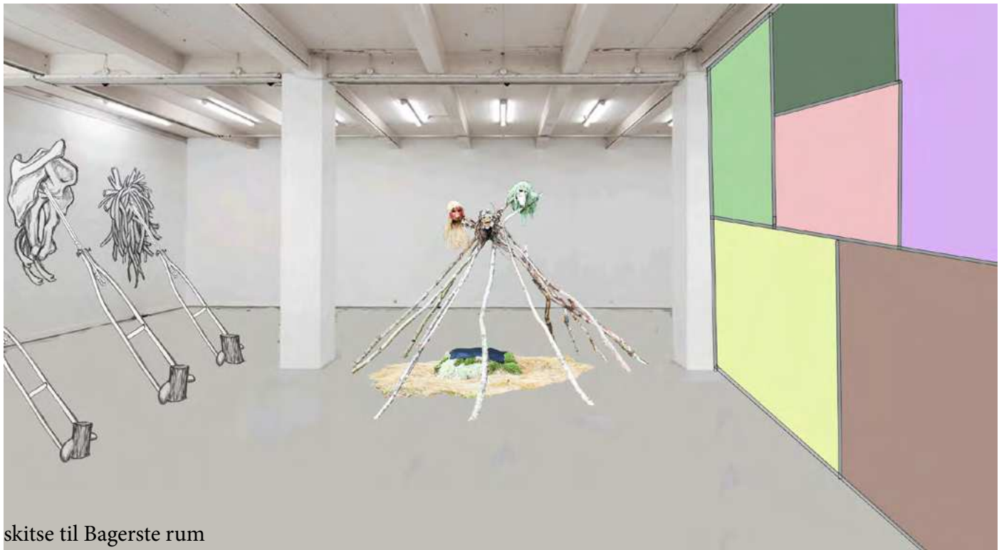
skitse til Bagerste rum