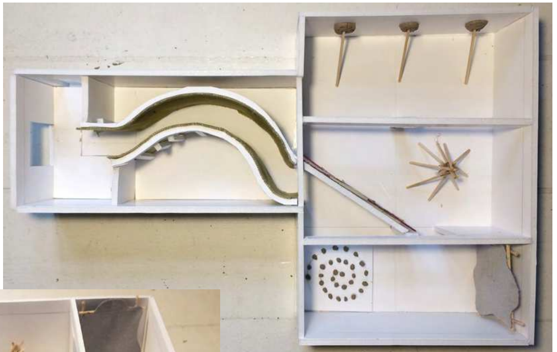
model over udstillingens opbygning