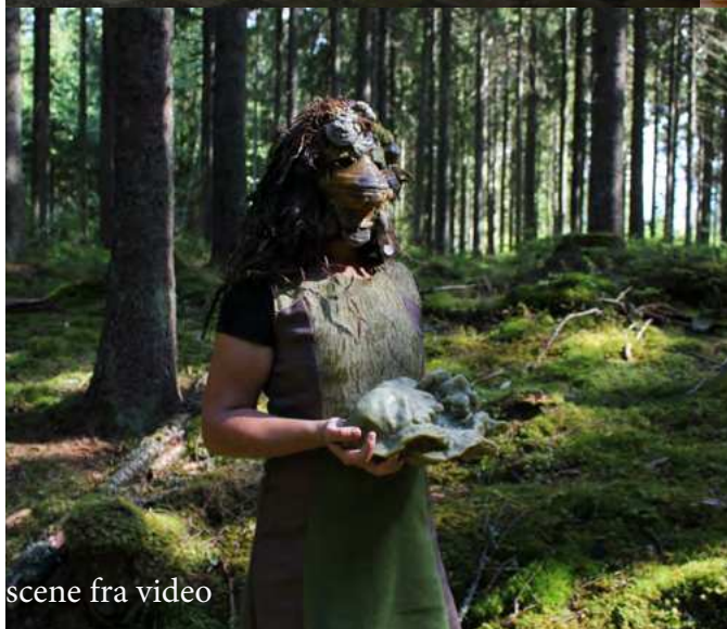
scene fra video