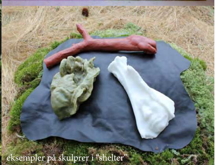
eksempler på skulpturer i "shelter"