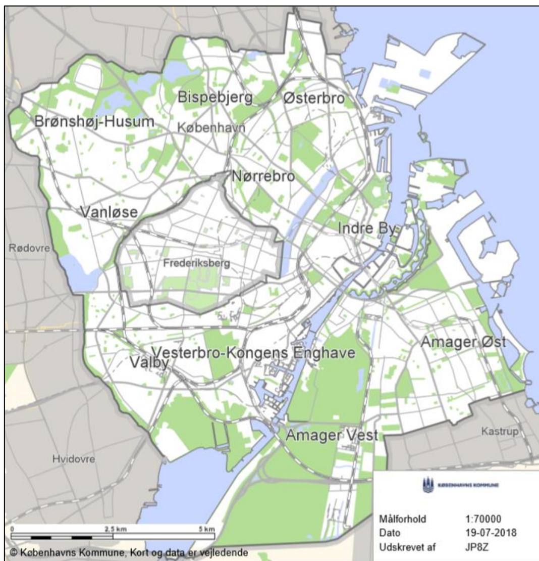
Figur 1. Københavns Kommune

Miljøtilsyn er et redskab, som Københavns Kommune (figur 1) benytter, til at sikre at byens virksomheder overholder gældende miljøregler, så der ikke forekommer væsentlig forurening af miljøet.