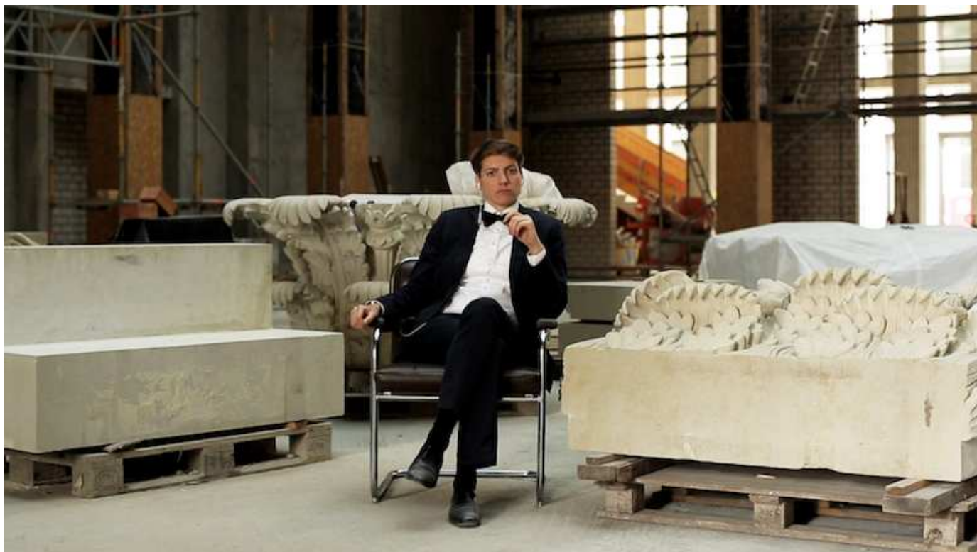
Kerstin Honeit: my castle your castle, 2017, still. Installation, mixed media, HD video, color, sound, 15 min.

Anmeldelse 15 dec 2017 Af Christian Meisels Asmussen