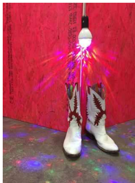
Kerstin Honeit: my castle your castle, 2017. Installation, mixed media, HD video, color, sound, 15 min.

Værket forholder sig polemisk til statens forhold til det historisk bevaringsværdige, og iblander queeræstetiske