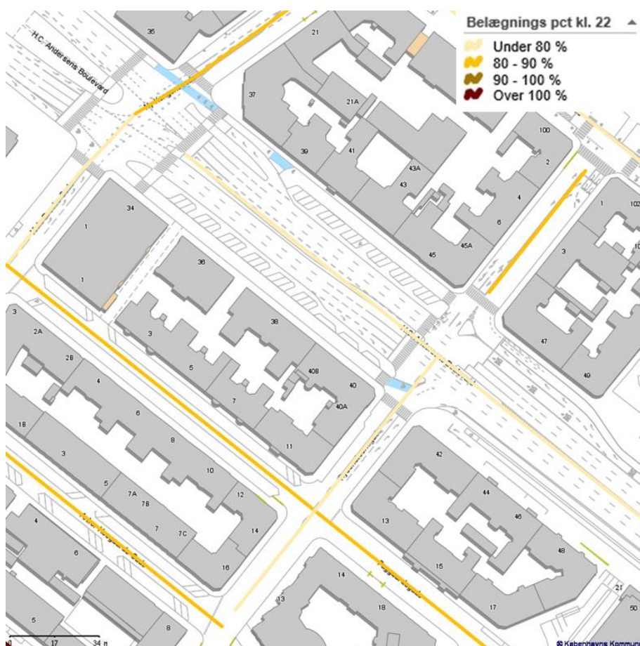
Kort 2: Belægning kl. 22 ved seneste tælling (oktober 2017)