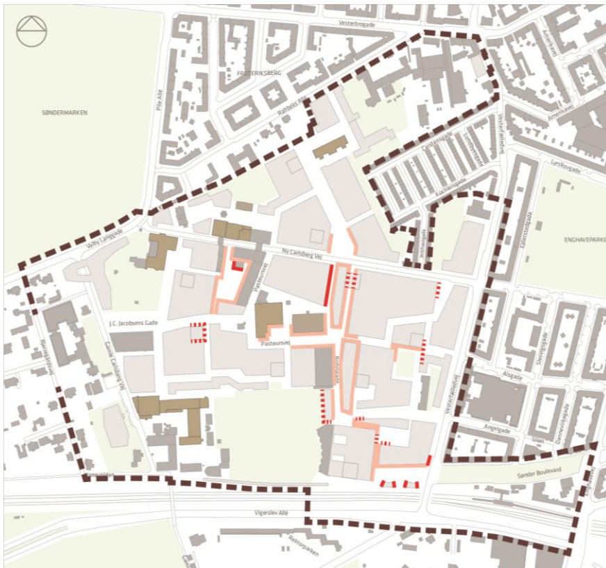
Illustration: RØDE FACADER

Store dele af de aktive facader forbliver uændrede (sart røde linjer).