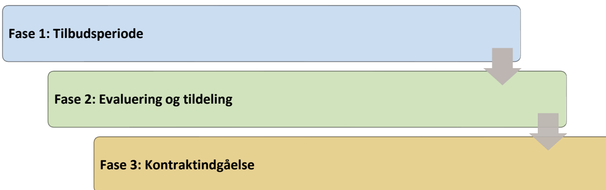
Illustration 1.1: Udbudsprocessens faser

Den overordnede tidsplan (illustration 1.2) indeholder de centrale milepæle og aktiviteter i udbuddet. Tidspunktet for en række milepæle og aktiviteter er fastlagt på forhånd. De er alle markeret med teksten "(fast)" efter aktivitetsnavnet. De øvrige tidspunkter er foreløbige datoer, som kan ændre sig. En faseopdelte tidsplan med de centrale milepæle og aktiviteter går igen under beskrivelsen af hver enkelt fase.