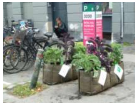
Et lille åndehul er opstået.