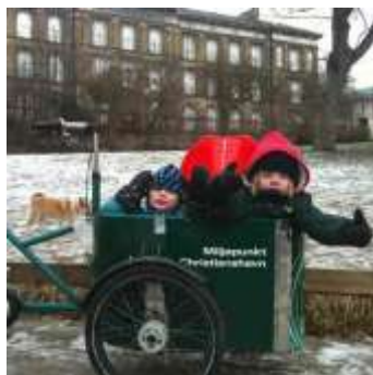
Miljøpunktets publikation om borgere der bruger ladcykel selvom de har bil.