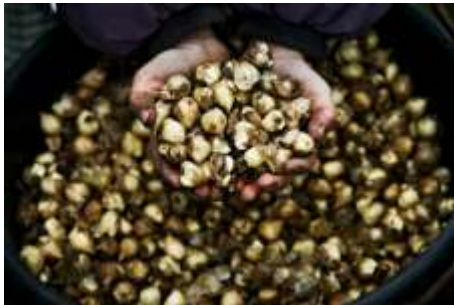
Blomsterløg klar til at blive plantet.