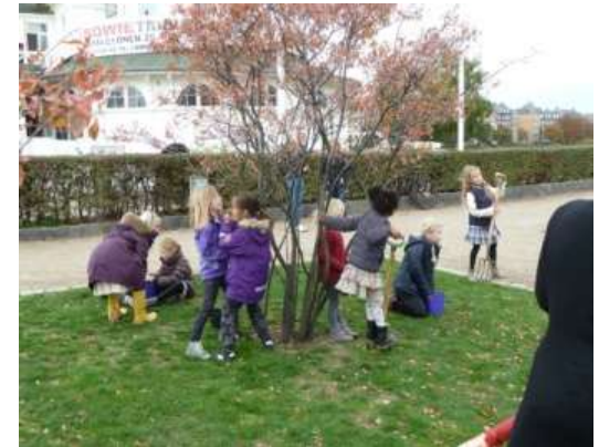
Børn fra børnehaver i indre by planter blomsterløg v. Lad Søerne Blomstre.