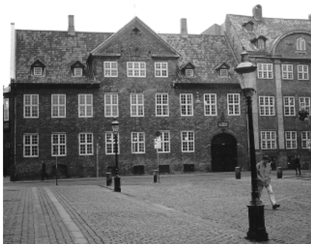
Type 3, Bispegården, Nørregade 11.

Type 4 omfatter bygninger, der er opført efter midten af det 19. århundrede. Stilistisk en mere uklar type, som i tidens ånd fremstår med en sammenblanding af forskellige stilarter. Endvidere indgår nyere bygninger, som rummer selvstændige arkitektoniske kvaliteter. Bygningerne har overvejende bevaret det oprindelige facadeudtryk, eller såfremt der er foretaget ændringer, er disse tilpasset den enkelte facades særlige udtryk og indgår overvejende på harmonisk vis i den pågældende gadefacades arkitektoniske særpræg.