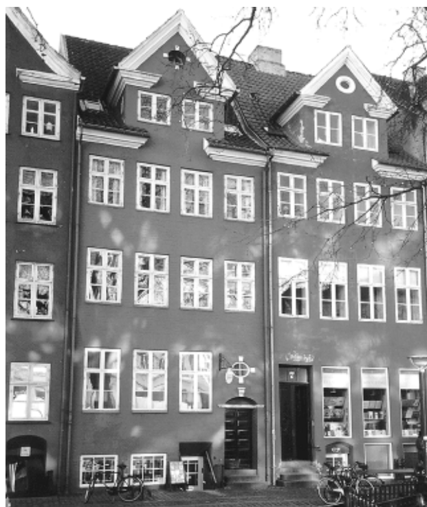
Type 1, Gråbrødretorv 5.

Type 2 - „ De klassicistiske borgerhuse “ - omfatter bebyggelsen, der er opført i begyndelsen af 1800-tallet, efter branden i 1795 og bombardementet i 1807, og som har bevaret det oprindelige facadeudtryk eller ældre, ombyggede huse, der har fået et klassicistisk udtryk. Christian Elling har i sin bog „Det klassicistiske København“ givet følgende meget dækkende karakteristik af de klassicistiske borgerhuse: - „Disse