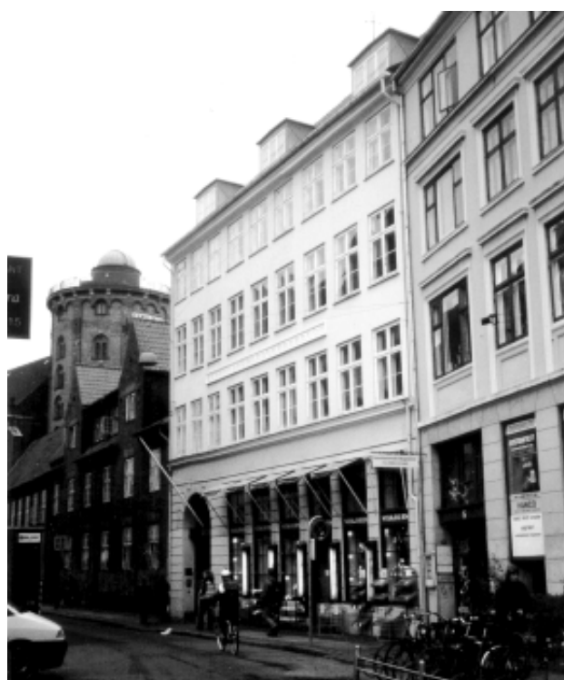
Type 2, Krystalgade 3.