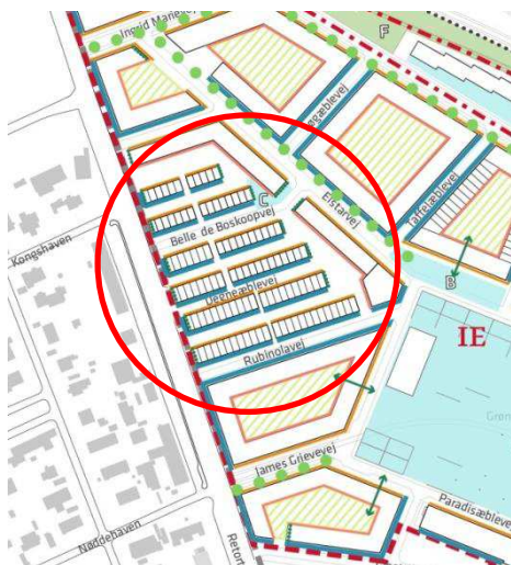
Tegning nr. 5

Det indstilles derfor, at tegning nr. 5 i bilag 1 ”Lokalplanforslag med kommuneplantillæg” korrigeres i forhold til placering af kantzoner for et begrænset antal ejendomme. Ændringen fremgår af nedenstående tegninger: