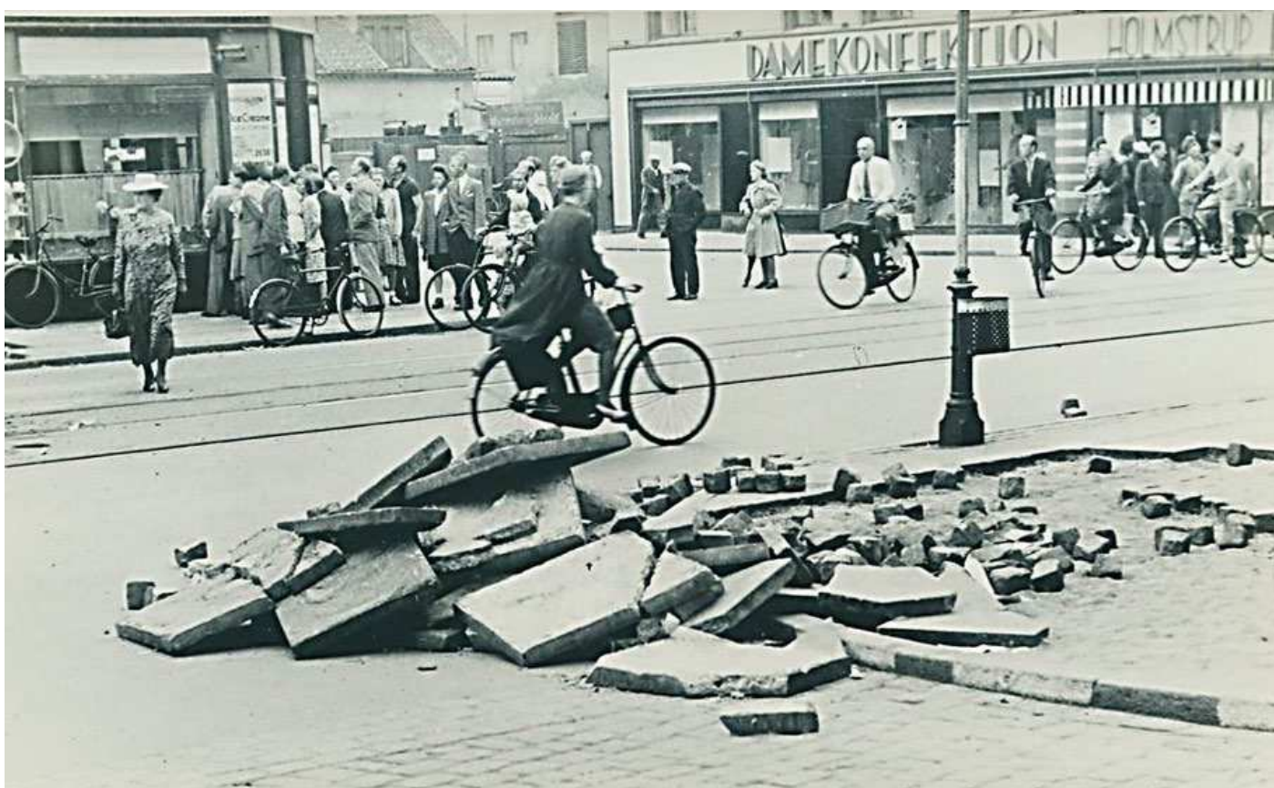
Barrikademateriale under Folkestrejken 1944