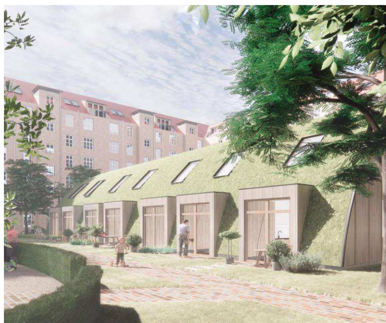
Den transformerede hal set fra nord