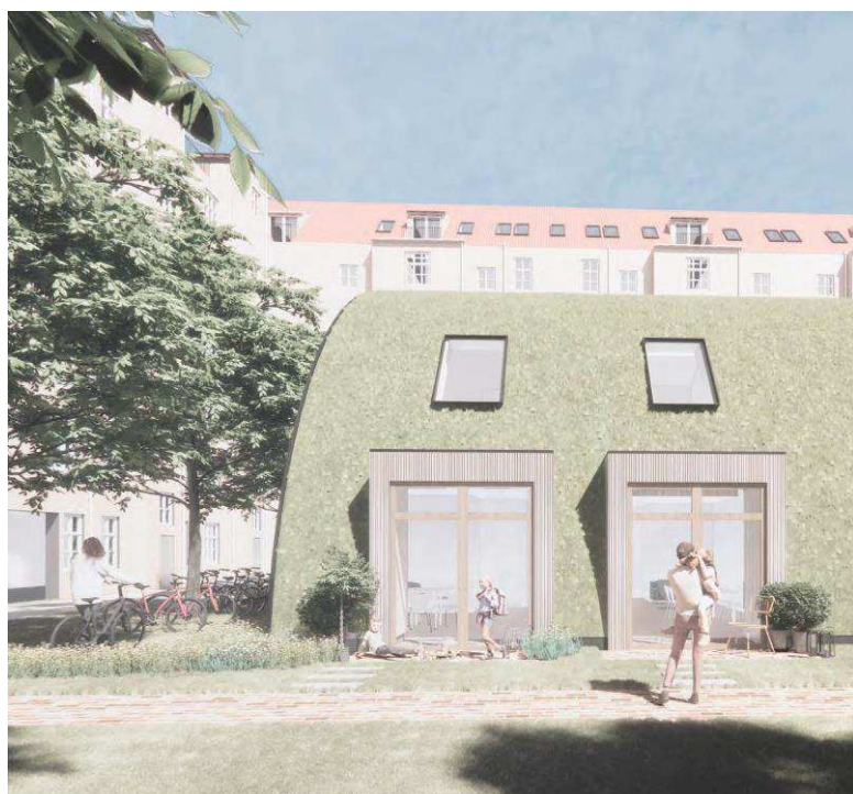
Den transformerede hal set fra nord (fra ansøgers materiale).