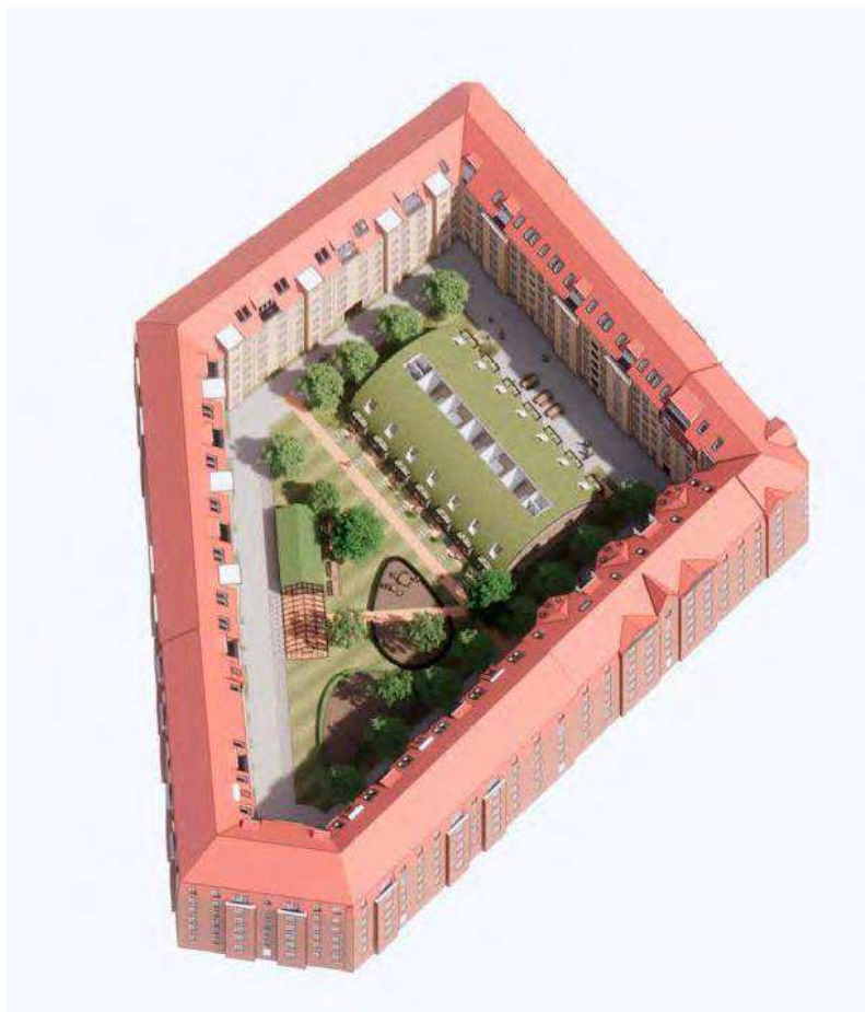
Badmintonhallen set ovenfra (fra ansøgers materiale)