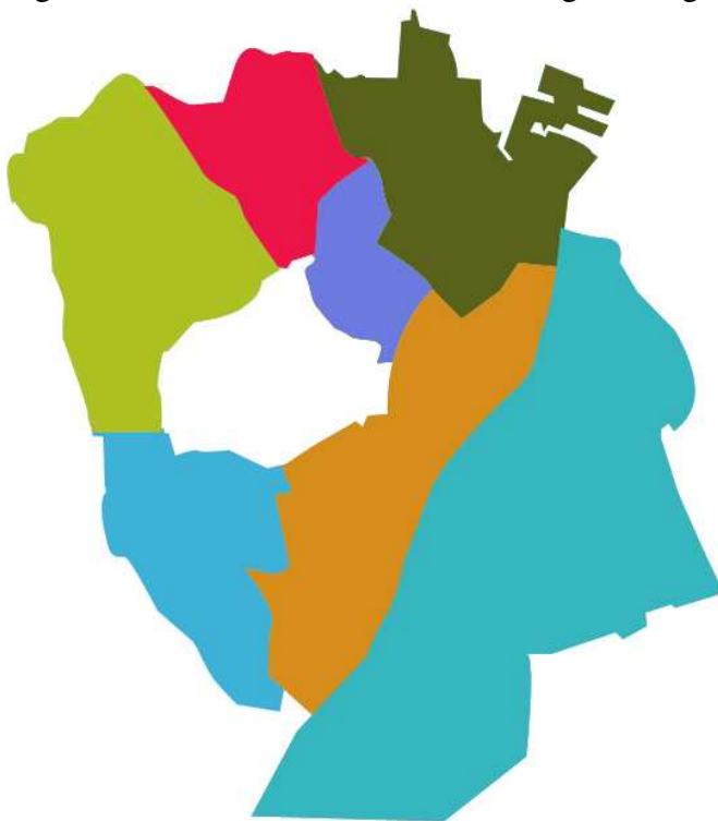
Figur: De 7 lokalområder i Sundheds- og Omsorgsforvaltningen

Sundheds- og Omsorgsforvaltningen gennemgik i 2003 en større organisationsændring. Under overskriften Fælles Ansvar blev der indført en koncernmodel med en direktion og med Bestiller-Udfører-Modtager-modellen som organiserende princip. På ældreområdet blev Københavns Kommune inddelt i syv lokalområder, hver med et ældrekontor (udfører) og et pensions- og omsorgskontor (bestiller).