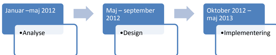
Figur 2 Implementeringstakt i projektet

Den samlede implementeringsperiode ventes at være i alt ca. 16 måneder. Såfremt analysefasen påbegyndes i oktober 2012 vil det nye domæne kunne være fuldt implementeret i løbet af efteråret 2013. Det betyder, at effektiviseringen i 2013 har 1/4 effekt.