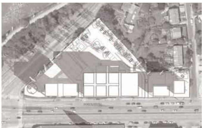
21. marts kl. 9.00