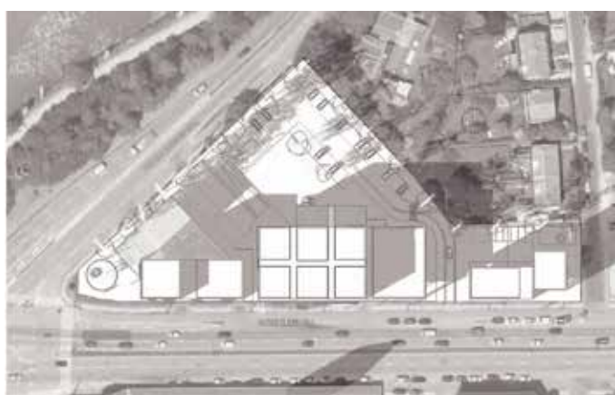
21. marts kl. 16.00