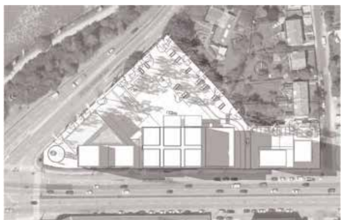
21. juni kl. 19.00

Skyggediagrammerne viser, at den omkringliggende bebyggelse kun i begrænset omfang vil blive berørt af skygge fra de kommende byggerier.