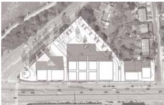
21. marts kl. 12.00