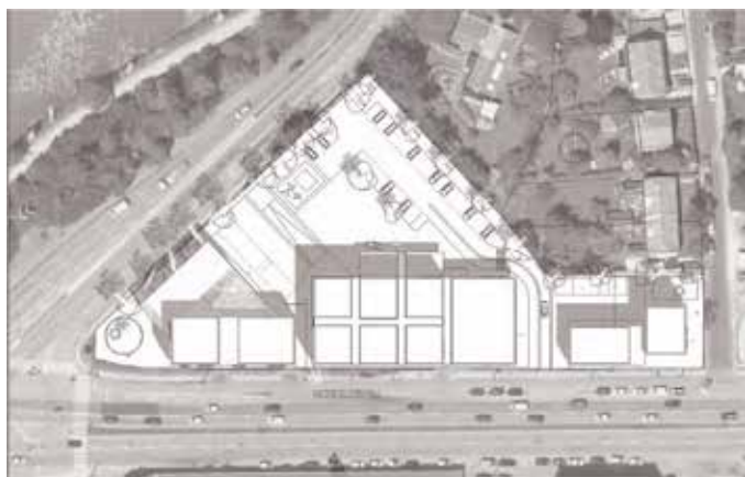
21. juni kl. 12.00