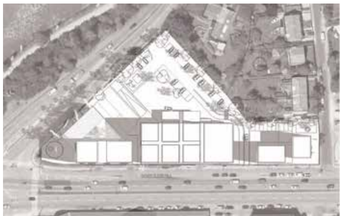
21. juni kl. 9.00