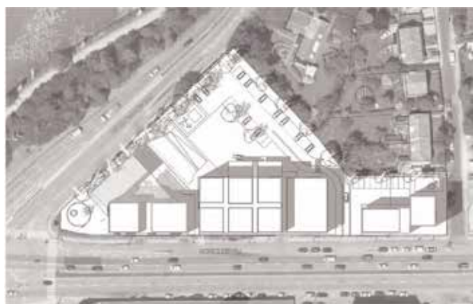
21. juni kl. 16.00