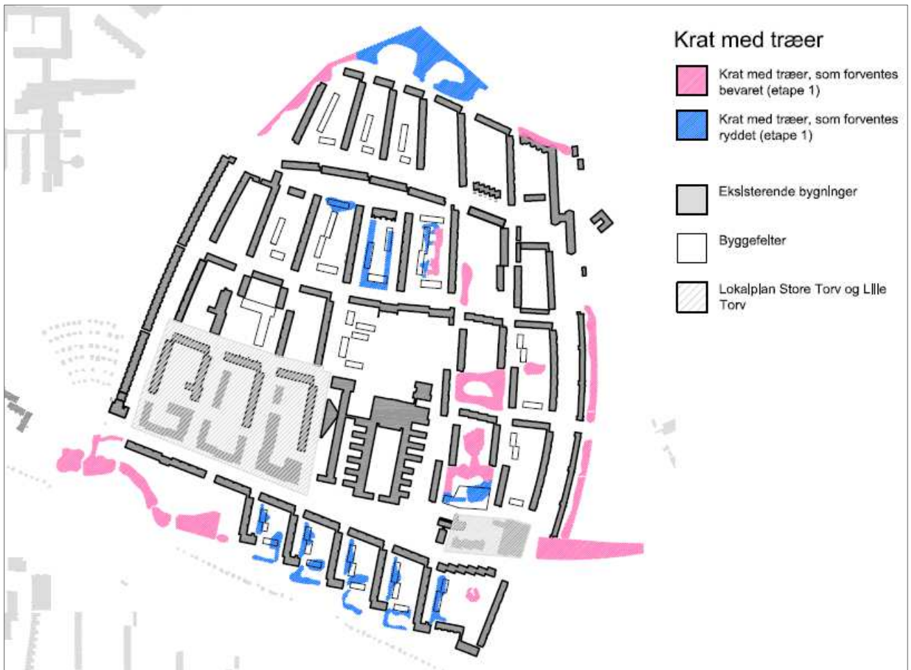
Områder med træer, krat og beplantning. Lyserød markering viser den omtrentlige afgrænsning af områder som forventes bevaret i etape 1 og blå viser den omtrentlige afgrænsning af områder som forventes ryddet i etape 1. Illustration: SLA