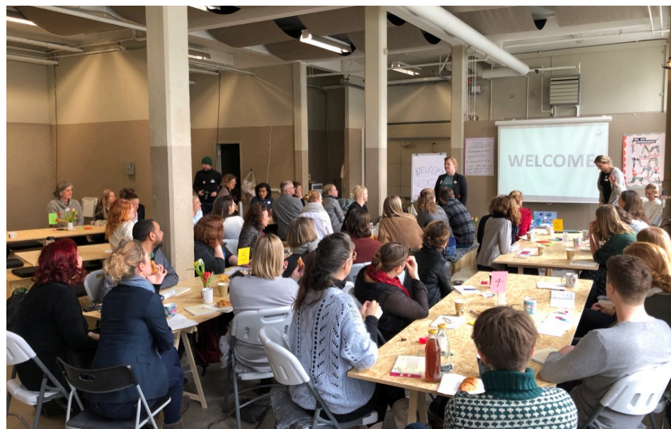
50 demokratiaktører fra 10 landet testede GARAGE-prototype på ISS grunden, marts 2019

ISS-grunden i Nordvest er under omdannelse til moderne boliger, der kan omfavne nye boformer. Projektet frigiver flere tidligere værkstedsbygninger, som kan aktiveres til et aktivt demokrativærksted og åben ramme for fællesskaber på tværs af byen.