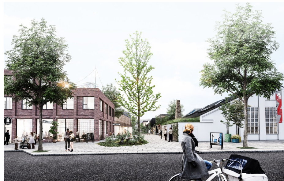
GARAGE er en integreret del af byudviklingen på ISS Grunden i NV

Denne ansøgning giver KFF mulighed for at kickstarte et mødested og kulturtilbud for demokrati og deltagelse. Der søges om støtte på 475.000,- til projektmodning og aktiviteter i opstartsfasen i 2019 - med afsæt i udvalgets frie midler.