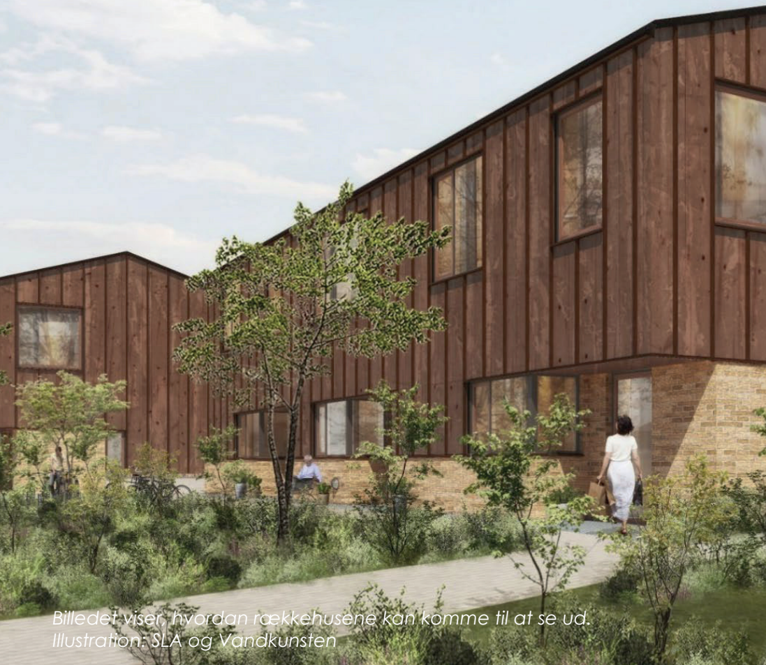
Billedet viser, hvordan rækkehusene kan komme til at se ud. Illustration: SLA og Vandkunsten