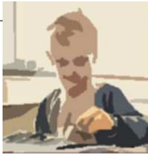
Figur 2: Borger-eksempler på indsatser omfattet af det tværgående højt specialiserede socialområde og specialundervisningsområde.