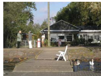
Kiosken Damhuskanten, som ligger i sydligste hjørne af Damhusengen.

Samspillet mellem overfladevand og grundvand er komplekst. I nogle områder vil en overudnyttelse af grundvandet kunne have en negativ indvirkning på overfladevandet i f.eks. søer og vandløb eller påvirke tilstanden af vådområder kraftigt. Det medfører, at tilstanden bliver ændret, hvilket i nogle tilfælde kan forringe områdets biologiske og rekre-