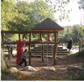
Parkernes legepladser er meget populære. Her ses et billede af soltemplet i Grøndalsparken.

I øjeblikket er optimistjollesejlads tilladt på den nordlige del af Damhussøen. Ligeledes foretages miljøundersøgelser og skolebørn sejles ud på søen i forbindelse med undervisning om vand med mere. Dette vil ikke hindres af fredningsforslaget.