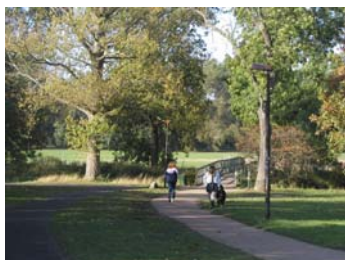
Indgangsparti til Damhusengen med bro over Harrestrup Å.

De grønne cykelruter er beskrevet i en pjeces fra Vej & Park fra år 2000. De blev introduceret som et nyt element i infrastrukturen for cykeltrafik i Kommuneplan 1997. I pjecen ses en rute fra Kalveboderne gennem Vigerslevparken, ved Damhussøen, Damhusengen, Krogebjergparken, kaldet Vigerslevruten og en rute gennem Grøndalsparken kaldet