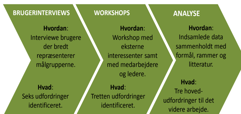
Figur 1: Den hidtidige proces

Overordnet set har der været tre faser i processen: Først interviewede en gruppe fra forvaltningen brugere for at få deres perspektiv. Dernæst afholdt forvaltningen workshops med henholdsvis eksterne og interne interessenter. Endelig har forvaltningen analyseret de fremkomne udsagn, så der er kommet et samlet billede af udfordringerne på området.