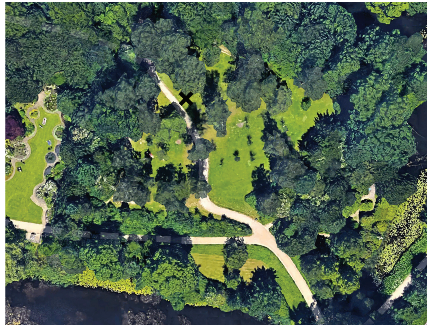
Markering af placering i Østre Anlæg