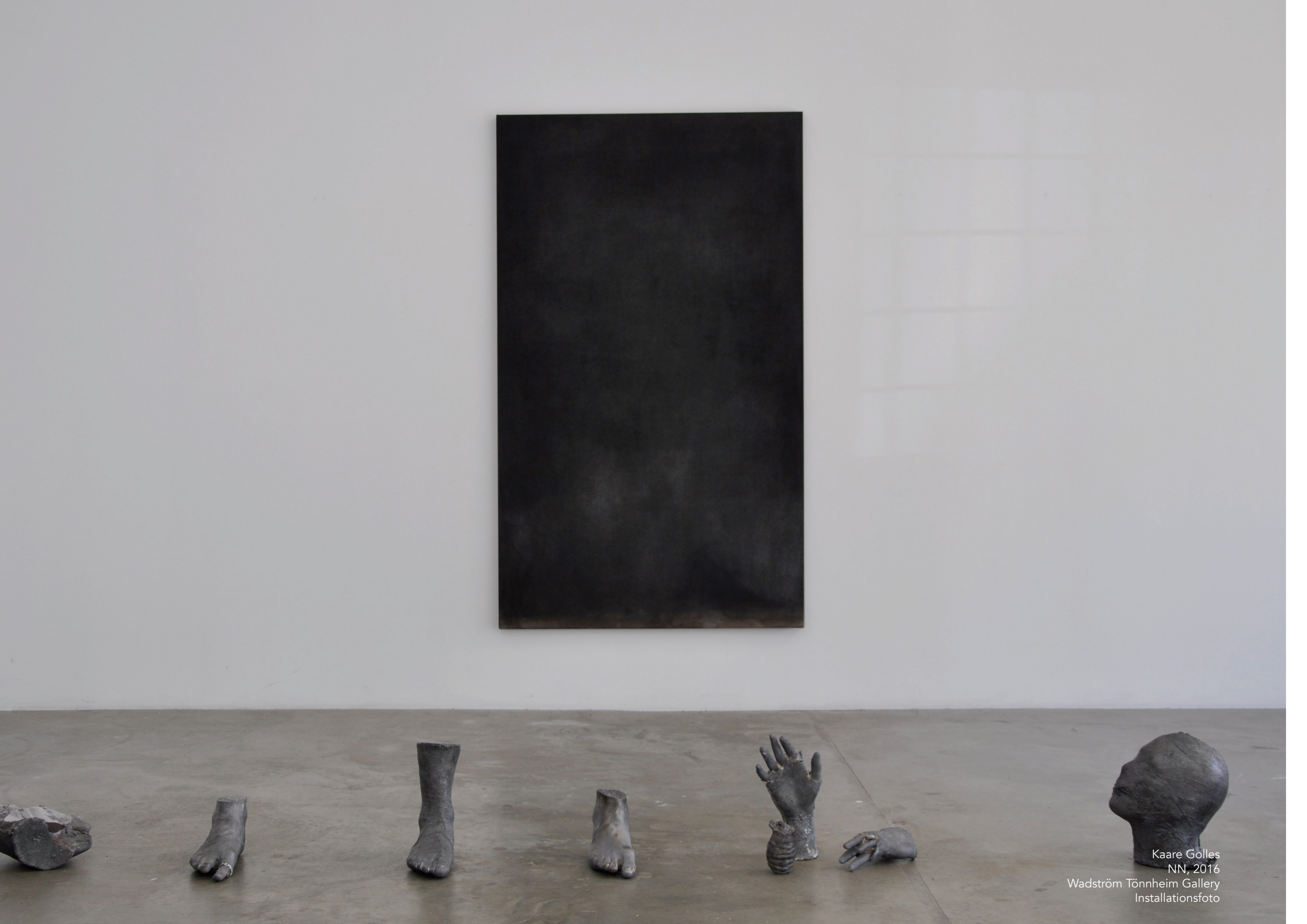
Kaare Golles NN, 2016 Wadström Tönneheim Gallery Installationsfoto