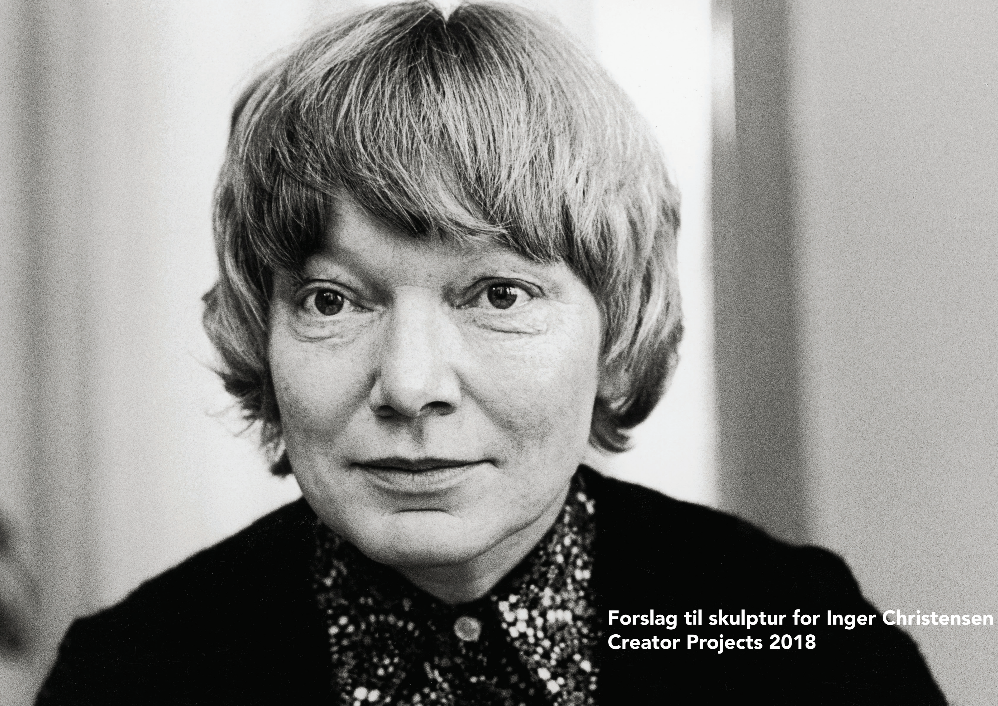
Forslag til skulptur for Inger Christensen Creator Projects 2018