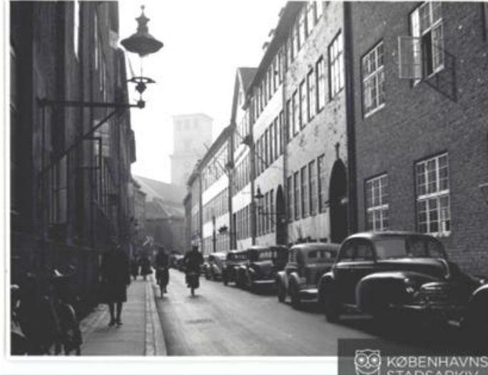
Figur 2. Fortov: betonflise – Kantsten – Vej: asfalt