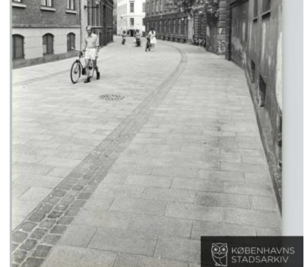
Figur 3. Fortov: gågadeflise (beton) – Ingen kantsten – Vej: gågadeflise (beton)