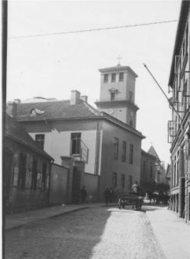
Figur 1. Fortov: brosten – Kantsten – Vej: brosten