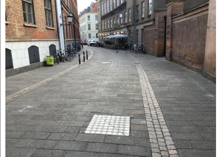
Figur 6. Fortov: gågadeflise (beton) – Ingen kantsten – Vej: gågadeflise (beton)