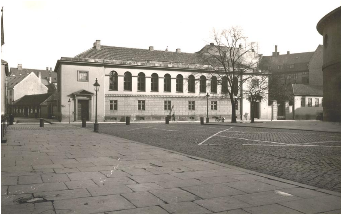
Figur 4. Metropolitanskolen set fra Frue Plads