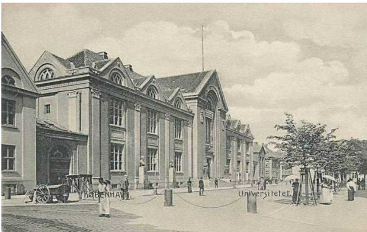
Figur 2. Frue Plads ca. 1900