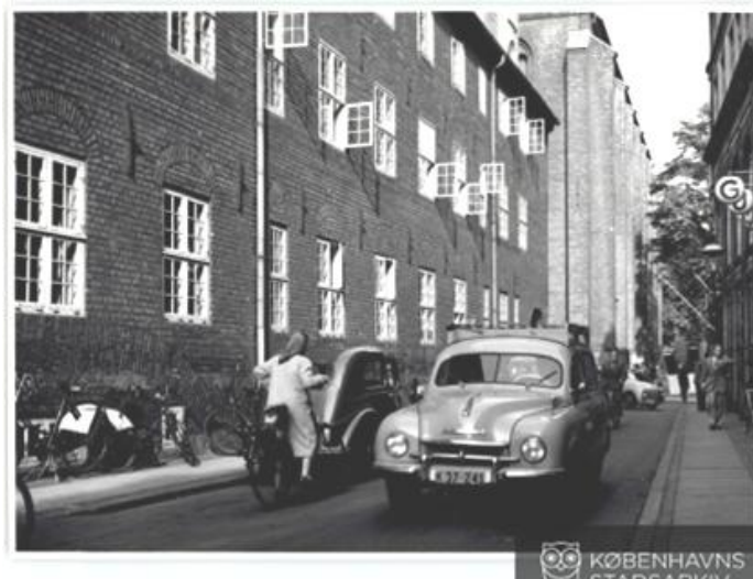
Figur 5. Fortov: betonflise – Kantsten – Vej: asfalt