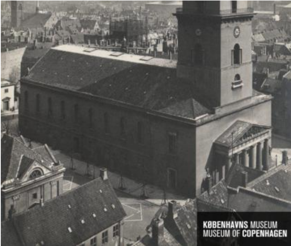
Figur 3. Frue Plads 1909