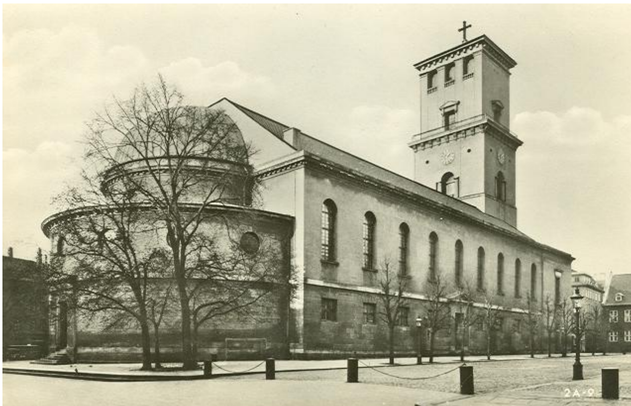
Figur 1. Frue Plads ca. 1900