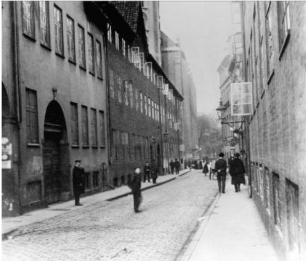
Figur 4. Fortov: brosten – Kantsten – Vej: brosten