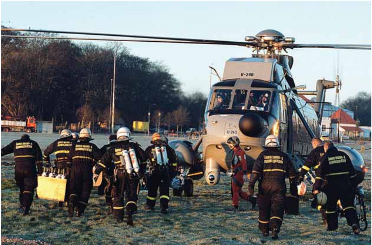
Uddannelse og øvelser er forudsætningen for et velfungerende beredskab. Her over det kommunale redningsberedskab sammen med en af forsvarets redningshelikoptere.