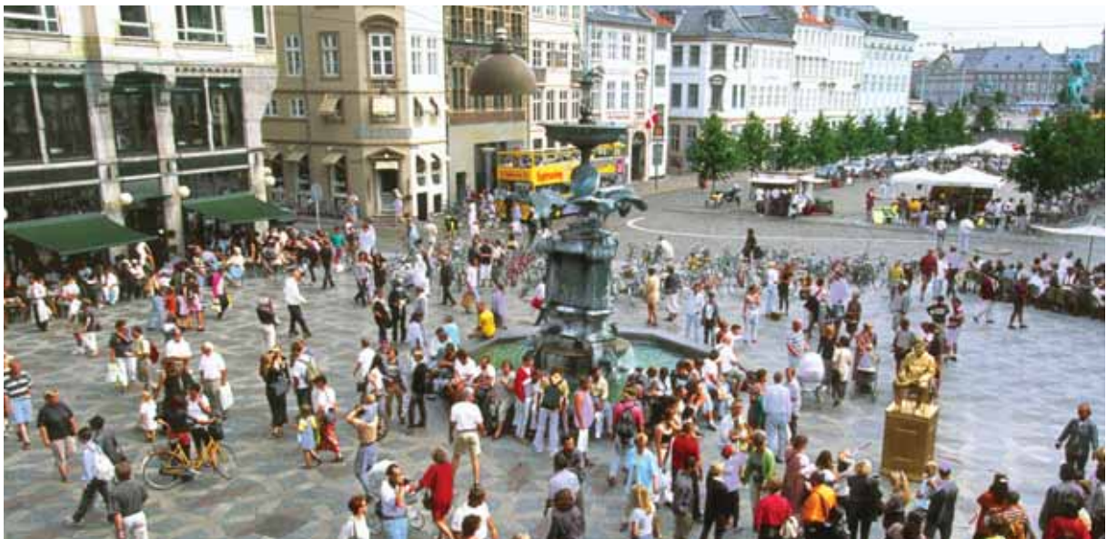
Et robust og sikkert samfund er alles ansvar.

Det er samtidig regeringens forventning, at alle påtager sig et ansvar i en krisesituation – det vil i realiteten sige alle lige fra offentlige myndigheder, organisationer, private virksomheder til hver enkelt borger. Således bør familie, venner og naboer eksempelvis hjælpe de ramte med omsorg og støtte i en krisesituation. Det sker også i dag, men vi skal blive bedre til det nære, såfremt robustheden i samfundet skal rodfæste sig. Det skal bl.a. ske ved, at beredskabsplanlægningen aktivt fremmer den enkeltes ansvar for sig og sine og mulighed for at redde sig selv i en krisesituation.