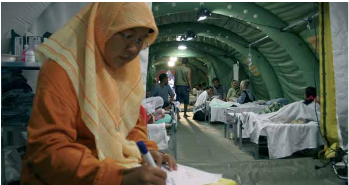
Danmarks mest markante hjælp til ofre for tsunamikatastrofen i Indonesien den 26. december 2004 var udstationeringen af et mobilt nødhospital fra Beredskabsstyrelsen. Det mobile nødhospital har ifølge WHO udført meget nyttigt arbejde.