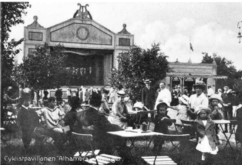
Amagerbrogade ved Sundbyvester Plads omkring 1910. Forlystelsesstedet Alhambra Park.

Omdannelsen af Sundbyøster Plads skal afstemmes med planerne for sportshallen på pladsen. Sportshallens aktiviteter tænkes sammen med kommende aktiviteter i forbindelse med nye indkøbsmuligheder på pladsen. Derfor er det en plads, som potentielt rummer mere aktivitet og liv. Lokaludvalgene har i forbindelse med omdannelsen af pladsen ytret ønske om, at gavlen på Sundbyøster Plads bliver inddraget som en del af det strategiske arbejde med kunst på Amagerbrogade. Frem for at placere et permanent værk på gavlen kunne det være en idé at udfordre grænserne for, hvordan byer traditionelt set arbejder med kunst på gavle, dvs. eksperimenterer med gavludsmykningen som genre og format. Man kunne fx iværksætte et forløb af værker, der udskiftes, som man bl.a. har gjort langs det gamle jernbanespor High Line i New York. Man kunne også arbejde med tekster på gavlen, f. eks. Klaus Rifbjerg og nulevende forfattere, som er bosiddende på gaden.