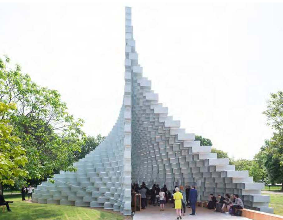
Bjarke Ingels Group / BIG Serpentine Pavillon, 2016

På tilsvarende vis kan en kunstner omsætte en ældre eller nyere begivenhed eller særlig amagerkansk kultur i en re-enactment og skabe rum for nye perspektiver på det tema, der er omdrejningspunkt for den pågældende re-enactment.