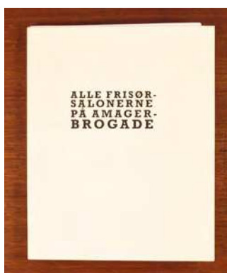
Lasse Krog Møller Alle Frisørsalonerne på Amagerbrogade, 2015