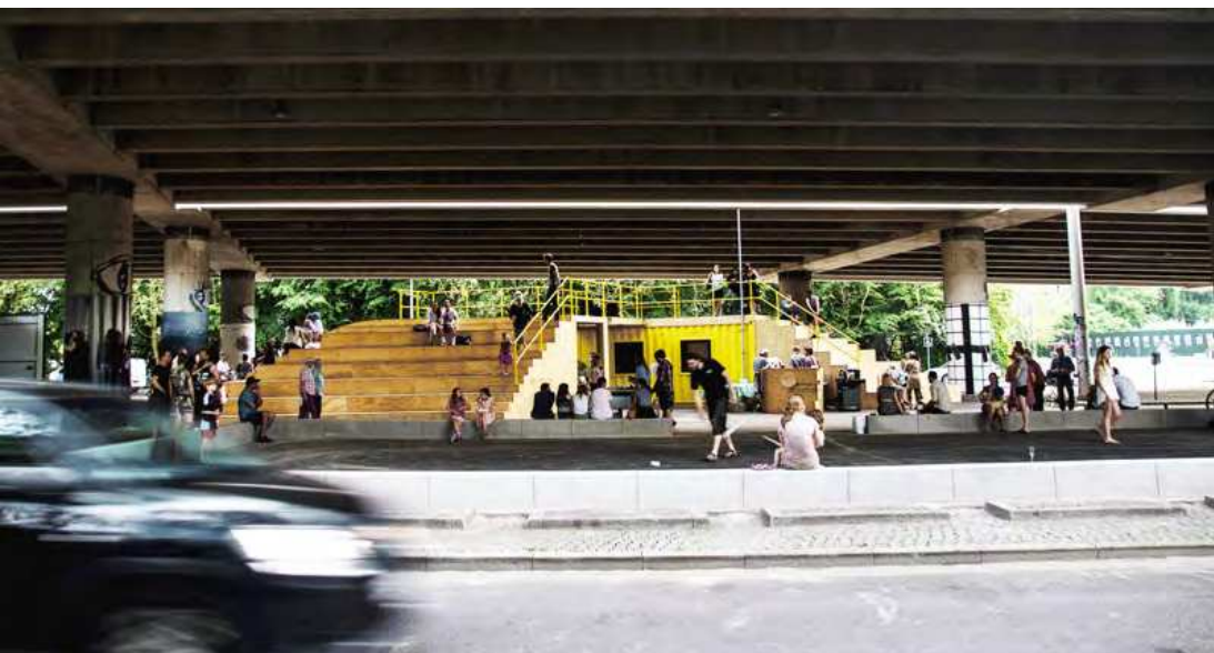
Det udendørs kulturhus Under Buen tegnet af Tegnestuen Platant © Platant Fotograf: Frederiksberg Kommune

I forbindelse med områdefornyelsen Nordre Fasanvej Kvarteret i Frederiksberg Kommune etablerede tegnestuen PLATANT i 2015 et udendørs kulturhus under Bispeengbuen. Projektet blev realiseret i 2015 og eksisterer midlertidigt frem til 2018. I 2016 er det blevet udvidet med et udendørs køkken som supplement til den eksisterende film- og musikscene, en amfiscene, fodboldbane, rutschebane og et skaterområde.