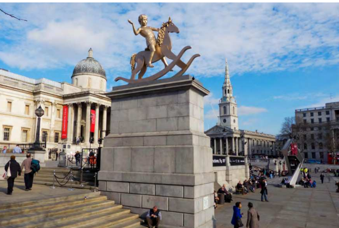
Elmgreen & Dragset Powerless Structures, Fig. 101 med øgenavnet “Golden Boy” Trafalgar Square’s Fourth Plinth afsløret af Joanna Lumley, London, UK, torsdag d. 23. februar 2012

På samme vis kunne Amagerbrogade danne ramme for et forløb af værker, der udskiftes med kortere eller længere mellemrum, for på den måde løbende at sætte fokus på en aktuel problematik, historisk begivenhed eller lignende.