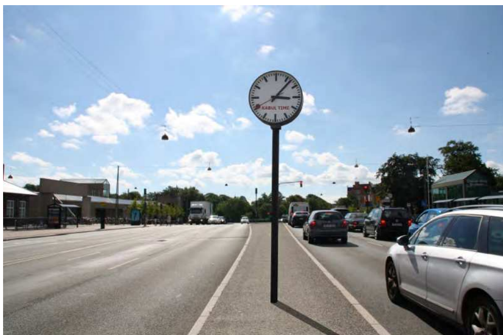
Jens Haaning Kabul Time, 2011 © Jens Haaning /copydanbilleder.dk

Værket er aldrig blevet realiseret i Danmark, men skulle som et dagligdags element i byrummet placeres et sted, hvor der dagligt passerer tusindvis af trafikanter, som en slags forstyrrende forflytning eller skæv kommentar til det moderne menneskes afhængighedsforhold til tid og til Danmark som del af en global virkelighed. I forbindelse med den midlertidige udstilling Malmö's Leende i september-oktober 2016 blev værket installeret i fjorten dage ved Trianglen Metrostation i Malmø.