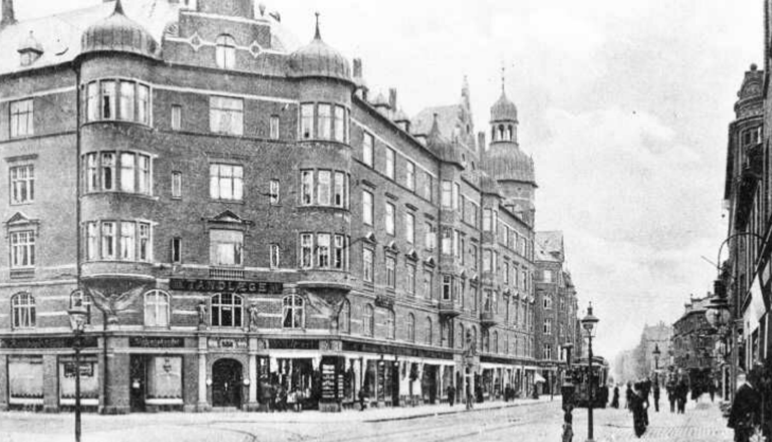
Amagerbrogade ved Holmbladsgade omkring 1910 Ejendommen Fredens Mølle.