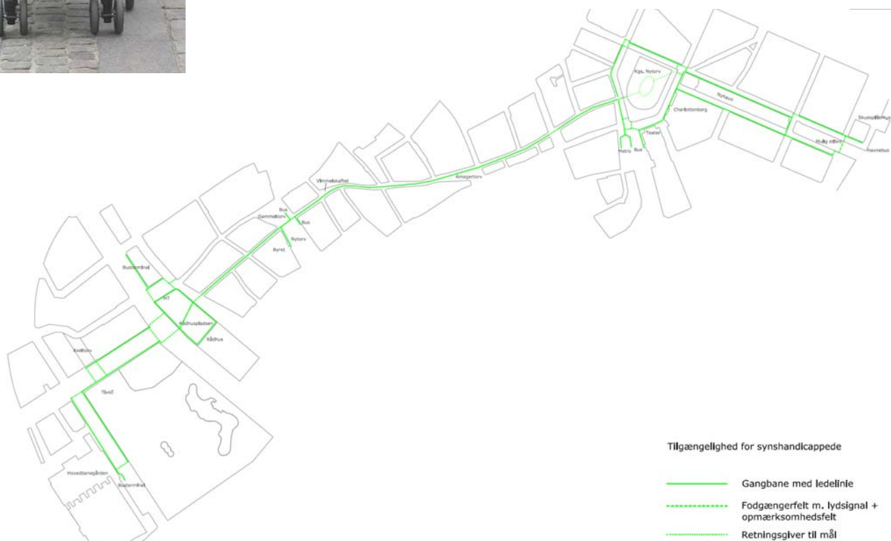
Figur 2. Tilgængelig rute for synshandicappede.

Da tiltagene for disse to hovedgrupper ofte er forskellige, er rutens forløb gennem nogle lokaliteter på strækningen ikke 100% identisk. Dette er illustreret på figurerne herunder.