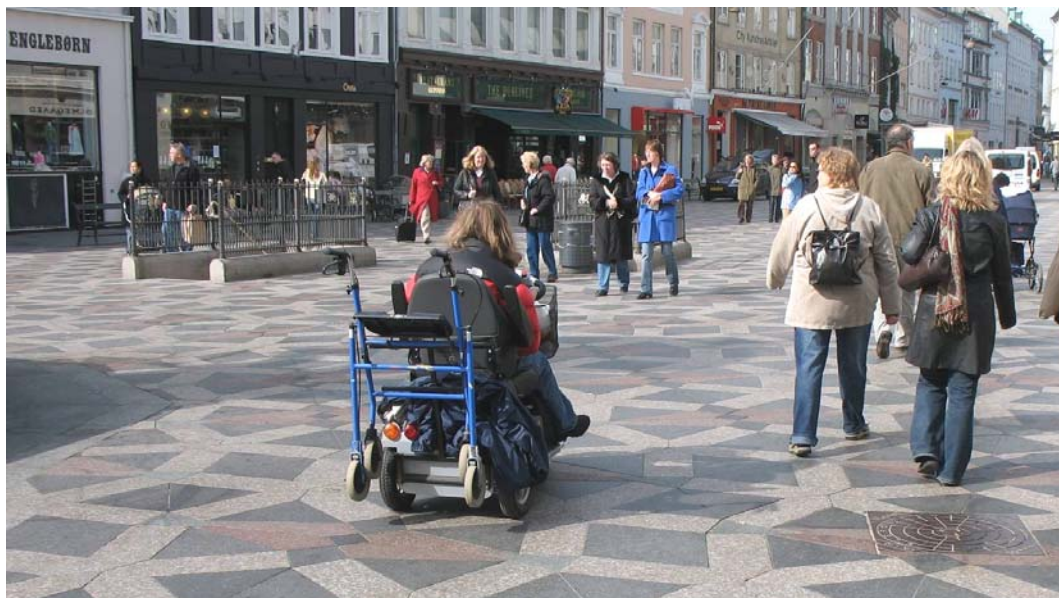
Figur 1: Amagertorv på Strøget er en af de mange centrale pladser, som indgår i tilgængelighedsruten.

Projektforslaget skal sikre, at alle kan færdes på en af de mest benyttede fodgængerruter i Indre By, over Rådhuspladsen, ad Strøget og dets centrale pladسدannelser til Kongens Nytorv og Nyhavn mod det nye skuespilhus og havnebussen.