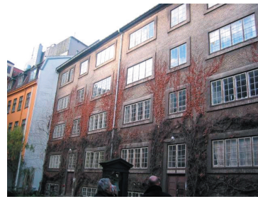
Den Sierstedske Stiftelse