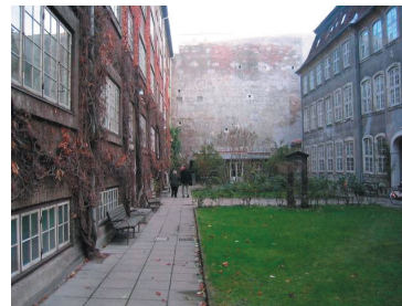
Den Harboeske Stiftelse