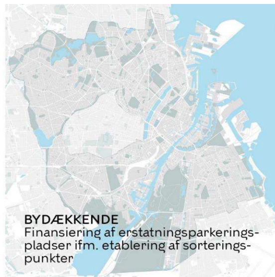
BYDÆKKENDE Finansiering af erstatningsparkeringspladser ifm. etablering af sorteringspunkter