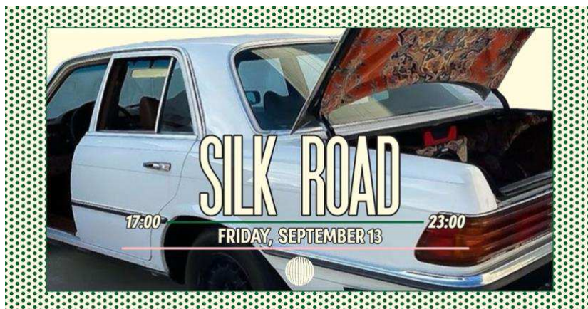
Artwork Silk Road vol. 2