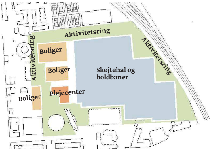
Scenarie 3 - Park- og aktivitetsring med indpasning af en skøjtehal, 30.000 m 2 boliger i 6-7 etager og 9.000 m 2 plejecenter - se ill. ovenfor og t.h.