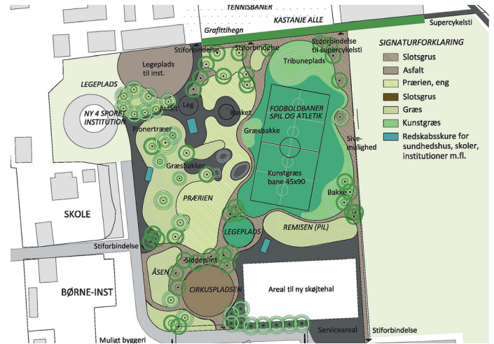
Osterbro Lokaludvalgs forslag til disponering af området