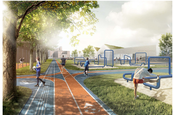
Illustration af park- og aktivitetsringen her fitness allé langs den nordlige afgrænsning af området. Denne del af aktivitetsringen er i princippet ens i alle tre scenarier