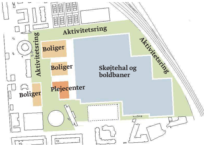
Scenarie 2 - Park- og aktivitetsring med indpasning af en skøjtehal, 15.000 m 2 boliger i 4-5 etager og 9.000 m 2 plejecenter - se ill. t.h. og nedenfor