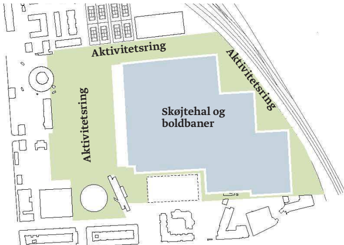
Scenarie 1 - Park- og Aktivitetsområde med indpasning af en skøjtehal, baseret på lokaludvalgets forslag, der er vist t.h.