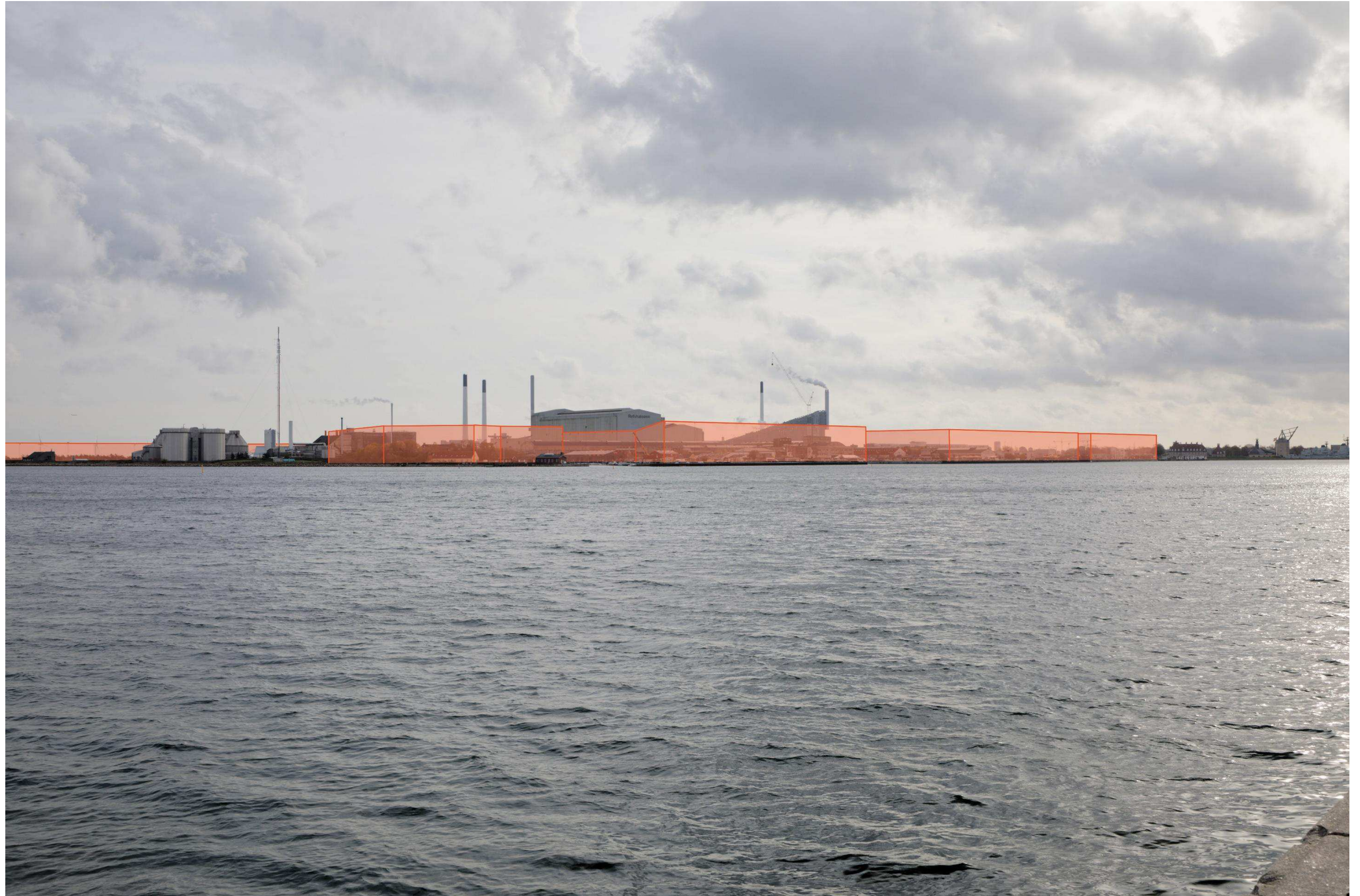
Figur 10 Fotostandpunkt 3 sydøst – fremtidige forhold set fra Langelinie. Til venstre ses en diagrammatisk angivelse af fremtidig bydannelse på Lynetteholm, hvor der til højre er angivet en bydannelse på Refshaleøen. Her vises hovedscenariet hvor Renseanlægget BIOFOS forbliver beliggende på Refshaleøen. Sektionshallen og BIOFOS på Refshaleøen, samt ARC placeret på Quintus, fremstår fortsat som de dominerende bygningsværker fra fotostandpunktet. Den mindre bygning placeret foran byudviklingsområdet længst mod venstre på skitsen er en del af BIOFOS anlæg og derfor ikke omfattet af byudviklingsområdet her.