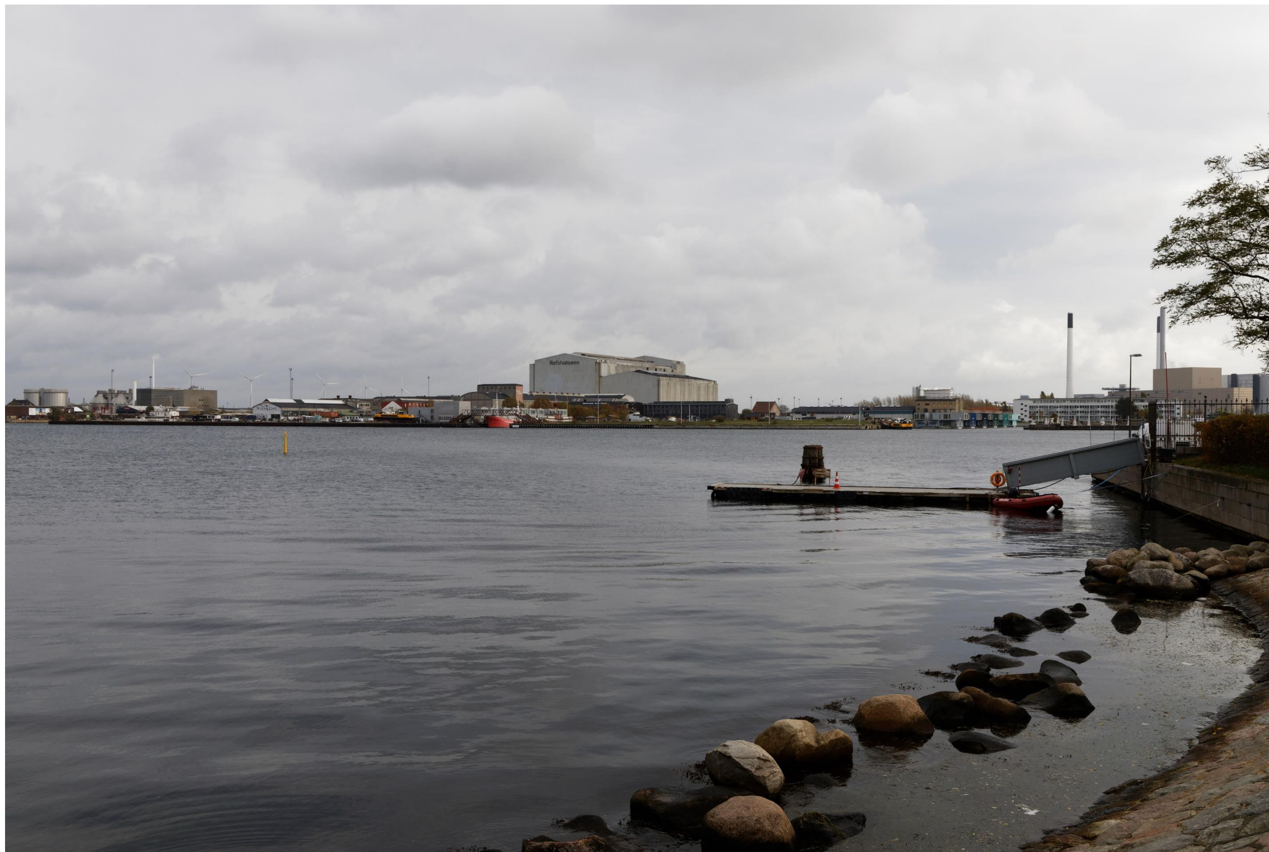
Figur 18 og 19 Fotostandpunkt 5 Øst - eksisterende forhold og 0-alternativet set fra Kastellet. 0-alternativet er tilsvarende de eksisterende forhold, da hverken Nordhavn eller Lynetteholm kan ses fra fotostandpunktet. 0-alternativet viser udsynet fra fotostandpunktet, hvis planen ikke gennemføres.