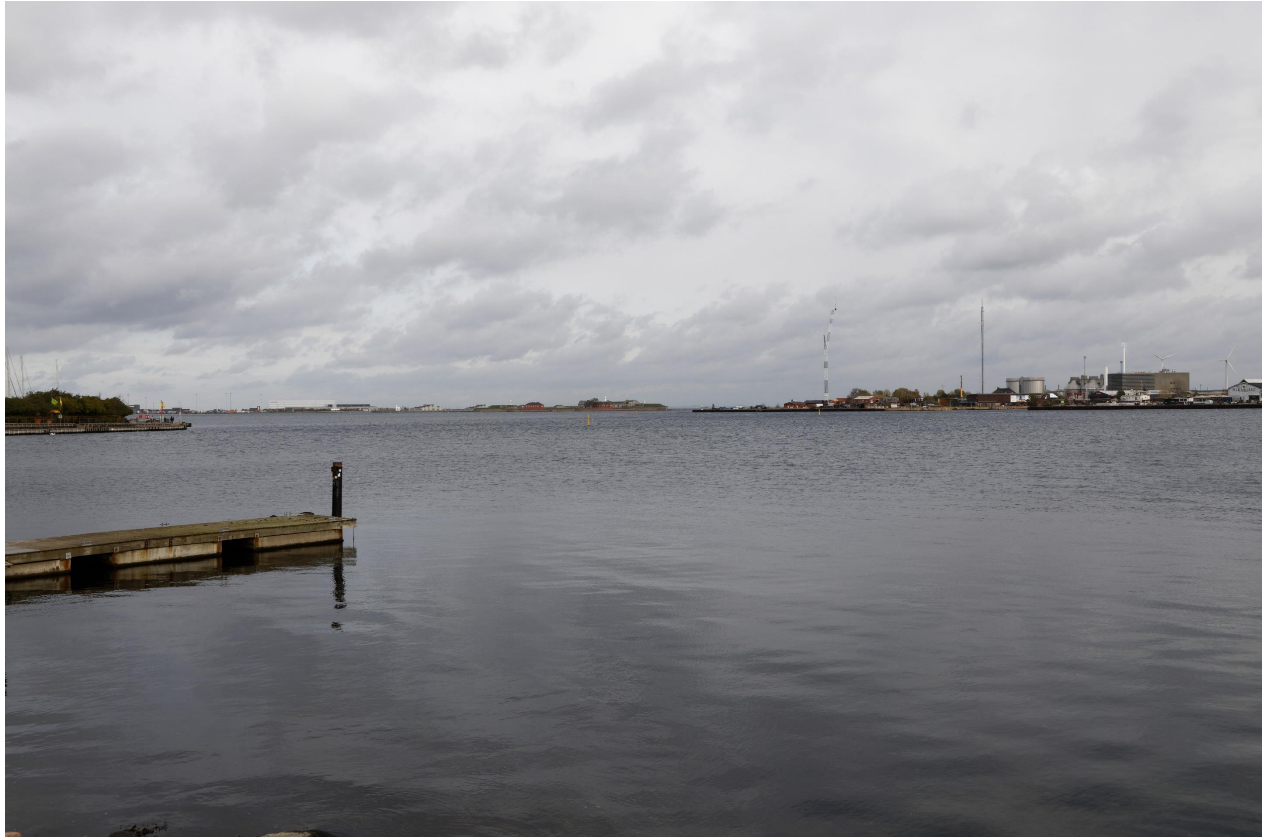
Figur 15 og 16 Fotostandpunkt 5 Nord - eksisterende forhold og 0-alternativet set fra Kastellet. 0-alternativet er tilsvarende de eksisterende forhold, da hverken Nordhavn eller Lynetteholm kan ses fra fotostandpunktet. 0-alternativet viser udsynet fra fotostandpunktet, hvis planen ikke gennemføres.