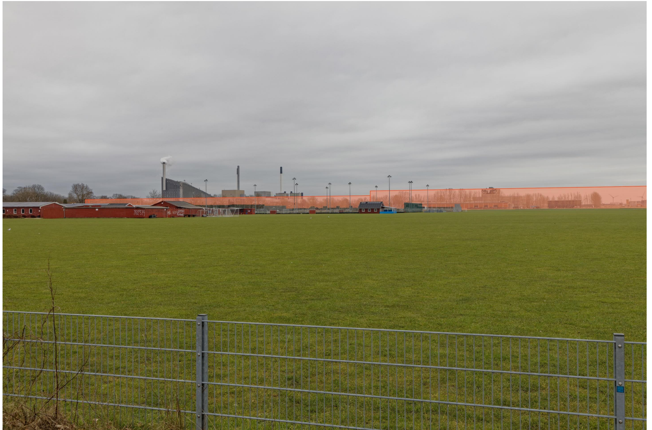
Figur 32 Fotostandpunkt 8 nordøst - fremtidige forhold set fra Kløvermarken. Til venstre ses diagrammatiske angivelser af en bydannelse på Quintus, hvor der til højre er diagrammatiske angivelser af en bydannelse på Kløverparken. I forgrunden er Kløvermarkens Idrætsanlæg og bagved er kolonihaveforeningen H/F Kløvermarken beliggende. Den sidste er ikke synlig på skitsen.