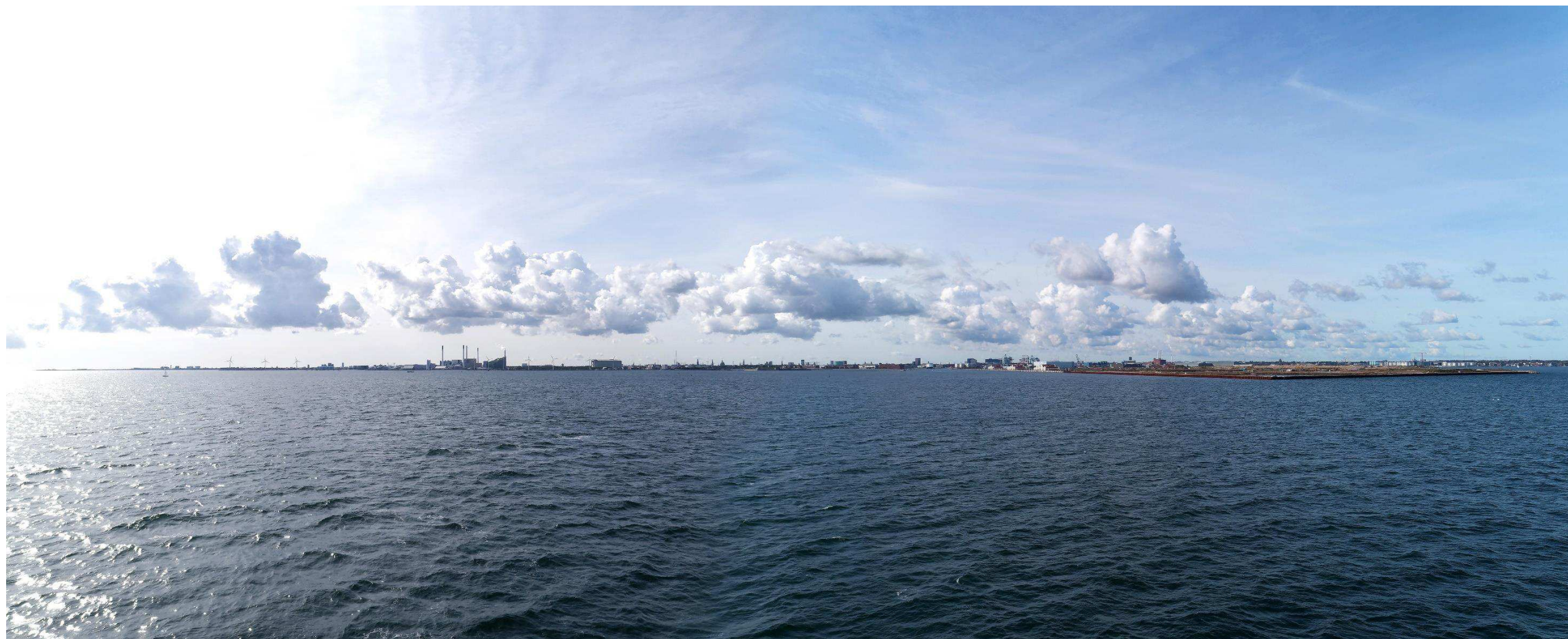
Figur 5 Fotostandpunkt 2 syd-sydvest - eksisterende forhold set fra Øresund.