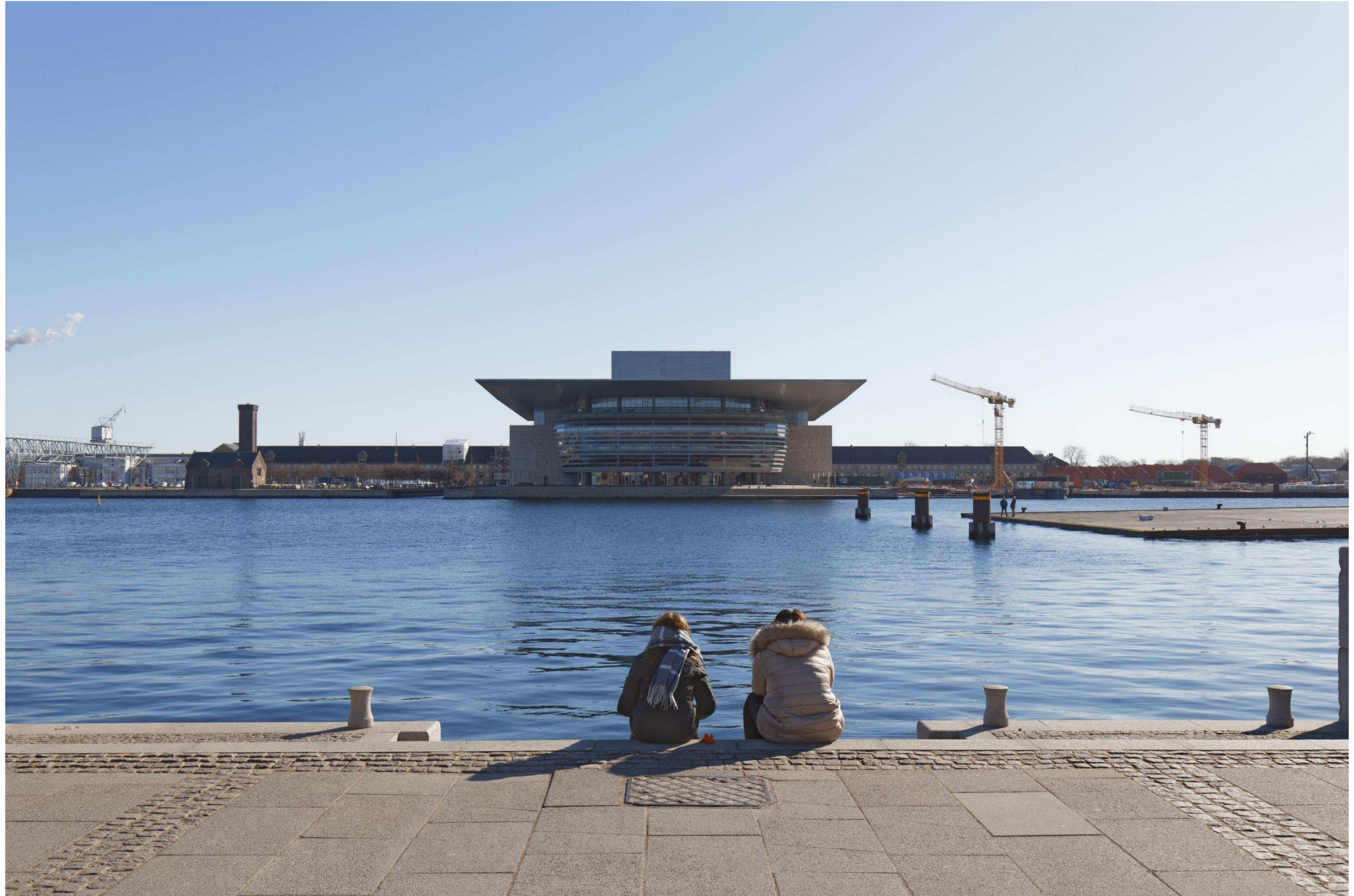
Figur 24 og 25 Fotostandpunkt 7 øst – eksisterende forhold og 0-alternativet set fra Amalienborg sigtelinjen. 0-alternativet er tilsvarende de eksisterende forhold, da hverken Nordhavn eller Lynetteholm kan ses fra fotostandpunktet. 0-alternativet viser udsynet fra fotostandpunktet, hvis planen ikke gennemføres.