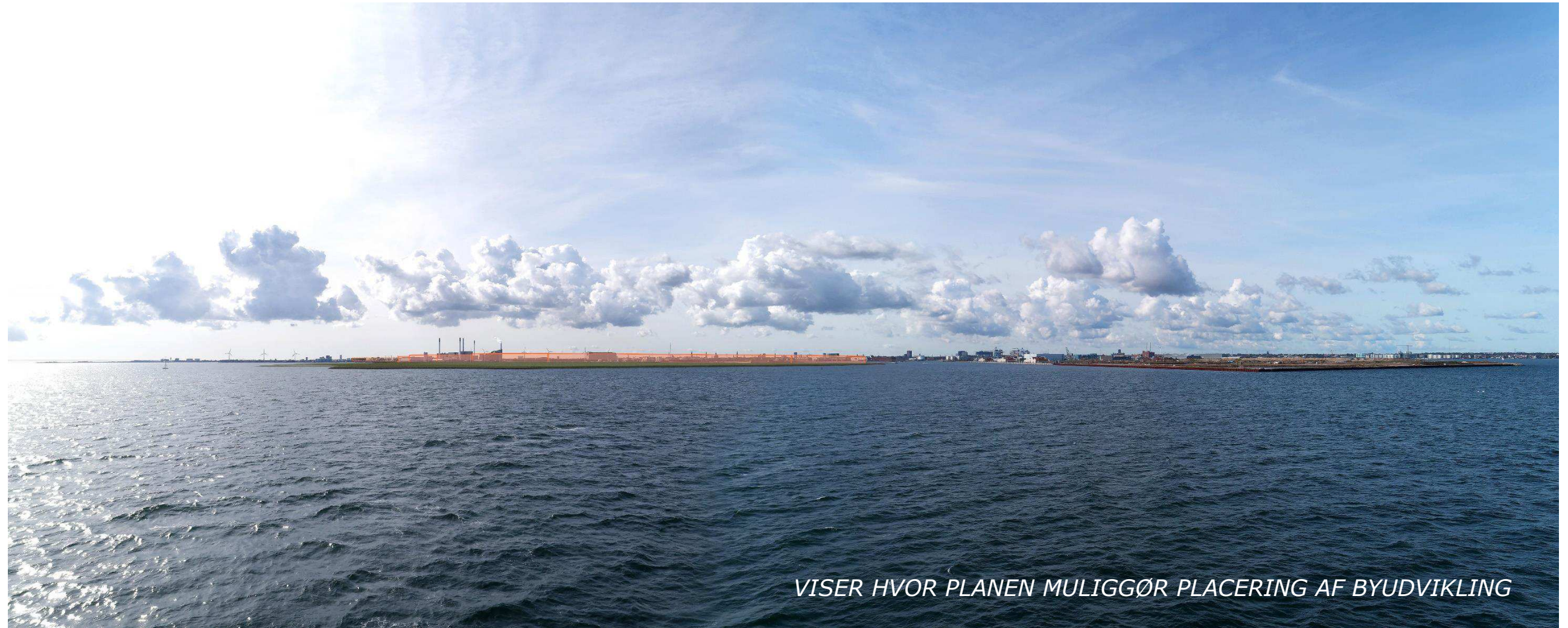
Figur 7 Fotostandpunkt 2 syd-sydvest – fremtidige forhold set fra Øresund. Til venstre ses Lynetteholm, hvor der ved diagrammatiske angivelser vises, hvor stor en del af det oprindelige view, der dækkes ved en sammenhængende bydannelse. Til højre vises Nordhavn ved et foto fra 2021. Der er en forventning om at byudvikle Nordhavn over de næste 30 år, hvilket vil være med til at påvirke udsynet fra fotostandpunktet.