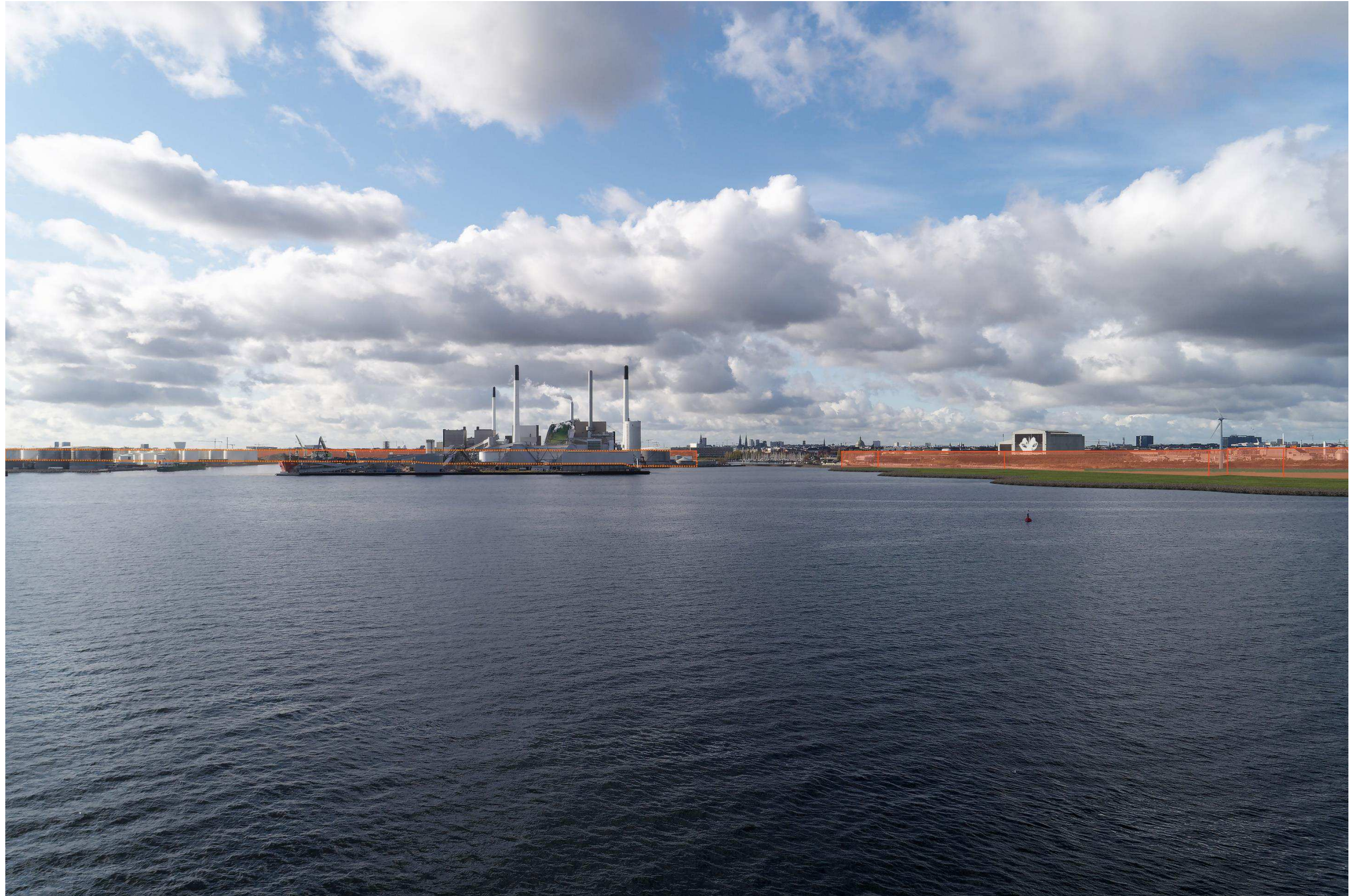
Figur 14 Fotostandpunkt 4 vest-sydvest – fremtidige forhold set fra Øresund øst for Lynetteholm. Til venstre angives der ved orange priksignatur bydannelse på Quintus og Kløverparken. Her vises hovedscenariet hvor renseanlægget BIOFOS forbliver beliggende på Refshaleøen. Til højre er diagrammatiske angivelser af bydannelse på Refshaleøen og Lynetteholm. Jordvejen som etableres mellem Quintus og Refshaleøen, i forbindelse med opfyldet af Lynetteholm fremgår af skitsen. Byens tårne kan anes mellem bydannelse hen over den eksisterende by. Sektionshallen på Refshaleøen vil fortsat dominere udsigten fra fotostandpunktet.