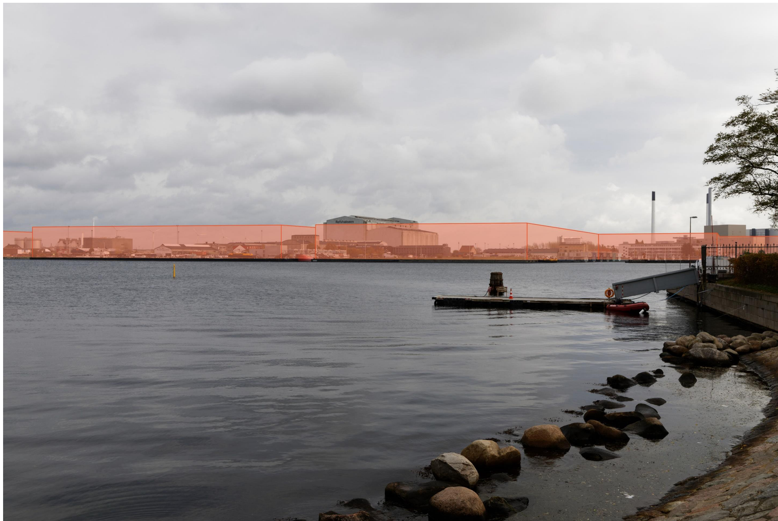
Figur 20 Fotostandpunkt 5 Øst – fremtidige forhold set fra Kasketlet. Her ses hvordan bydannelsen på Refshaleøen, påvirker udsigten fra fotostandpunktet. Sektionshallen på Refshaleøen vil stadig være dominerende for områdets skala.