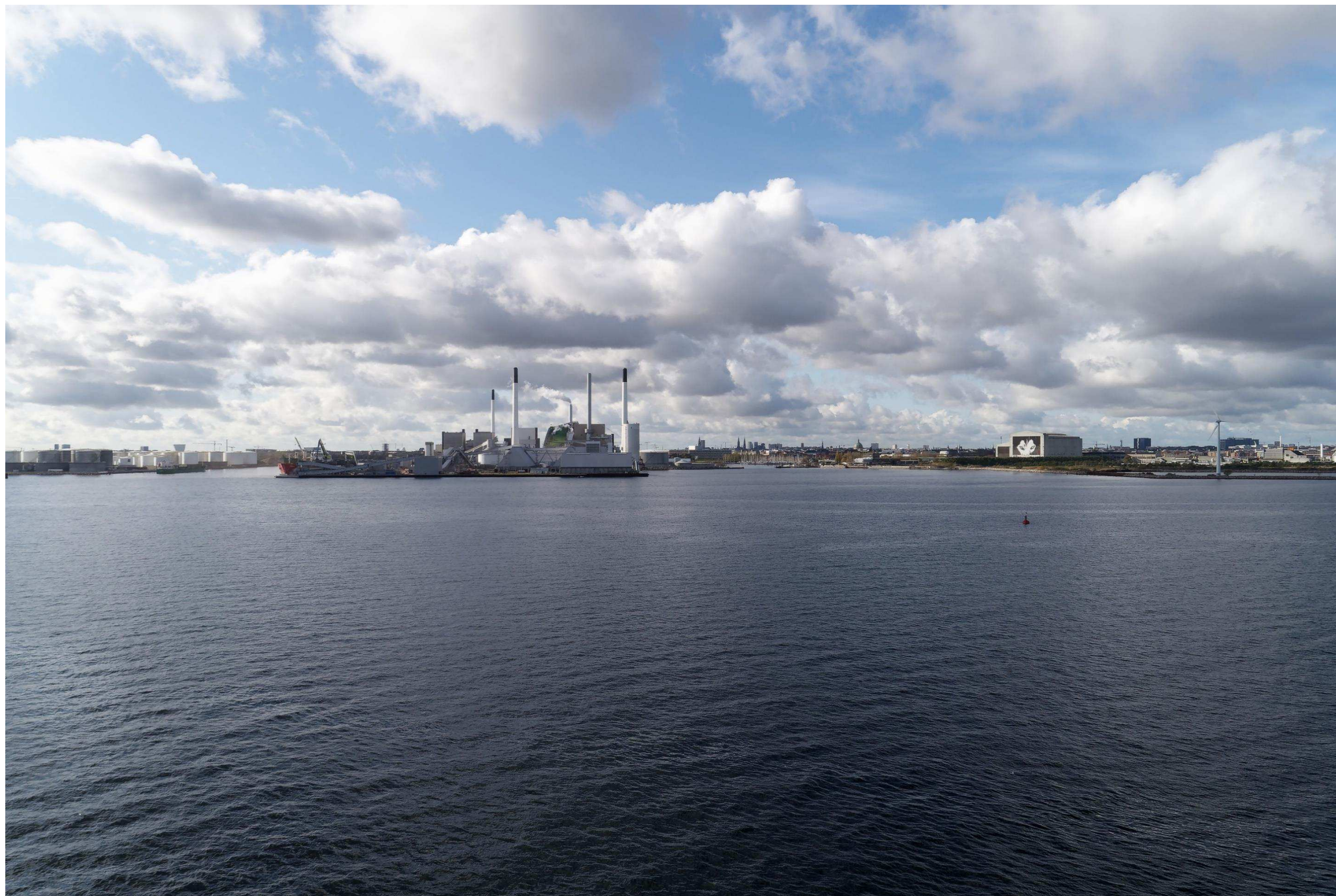
Figur 12 Fotostandpunkt 4 vest-sydvest - eksisterende forhold set fra Øresund øst for Lynetteholm.