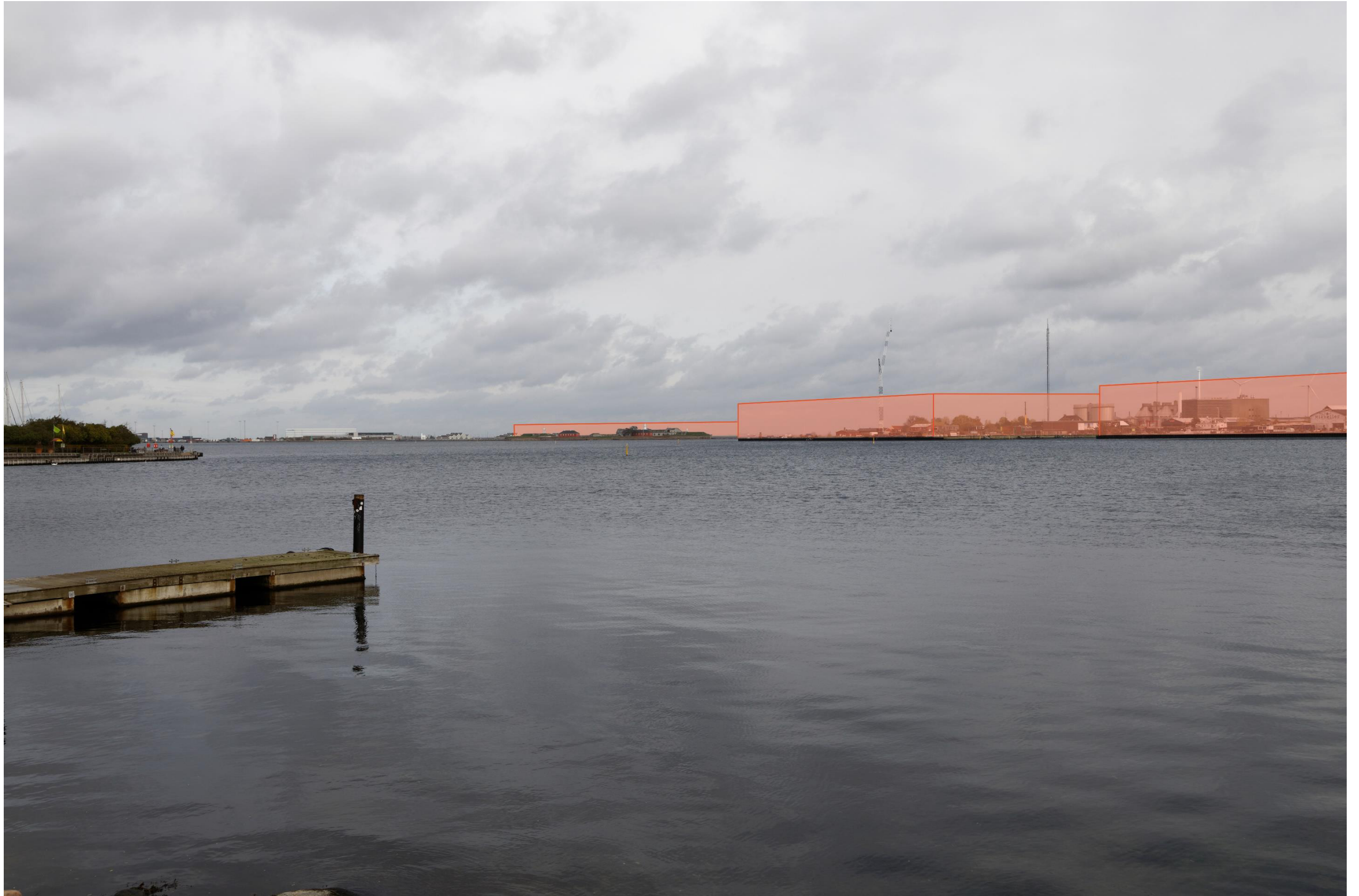
Figur 17 Fotostandpunkt 5 Nord – fremtidige forhold set fra Kastellet. Foran en fremtidig bydannelse på Lynetteholm er Trekroner beliggende, hvilket fortsat vil kunne ses fra fotostandpunktet. En fremtidig bydannelse på Refshaleøen, blokerer for udsynet til renselanlægget BIOFOS, der i dette scenarie forbliver beliggende på Refshaleøen.