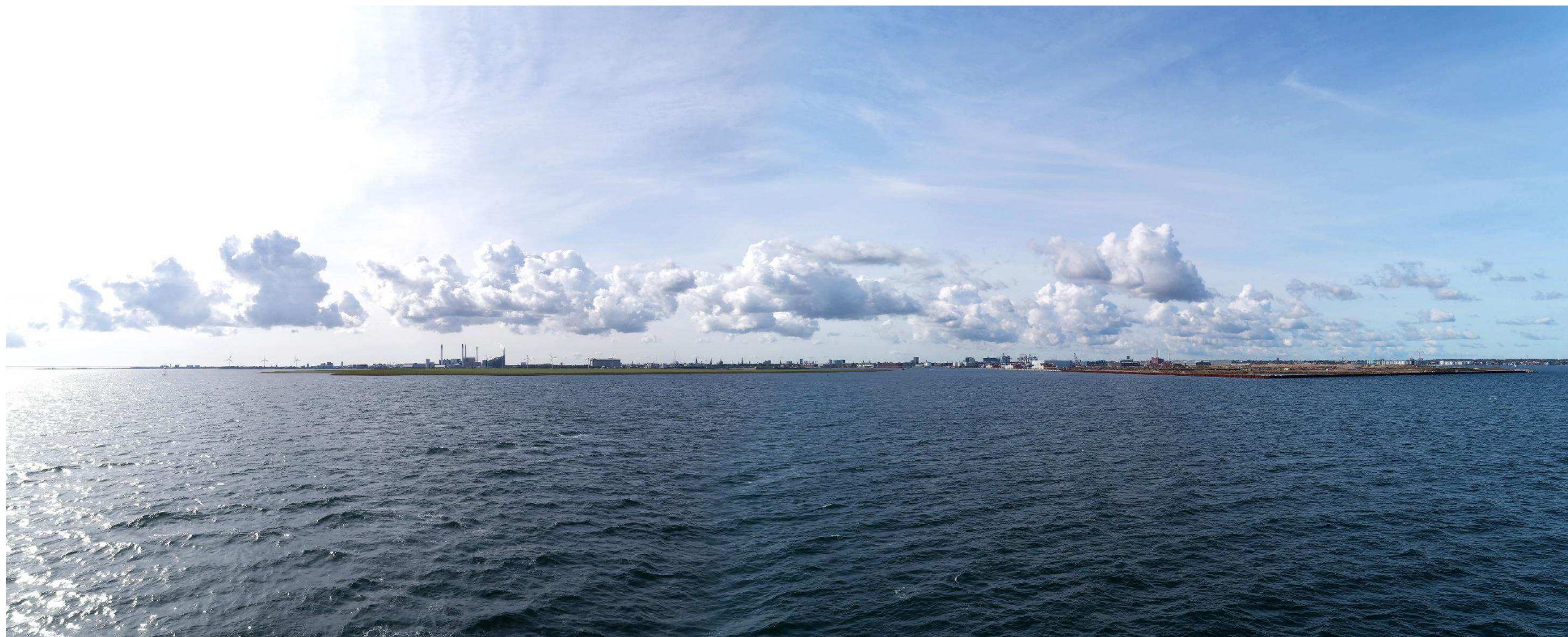
Figur 6 Fotostandpunkt 2 syd-sydvest - 0-alternativ set fra Øresund. 0-alternativet viser udsynet fra fotostandpunktet hvis planen ikke gennemføres. Lynetteholm er vist i kote 4 og Nordhavn er vist ved et foto fra 2020. Der er en forventning om at byudvikle Nordhavn over de næste 30 år, hvilket vil være med til at påvirke udsynet fra fotostandpunktet.