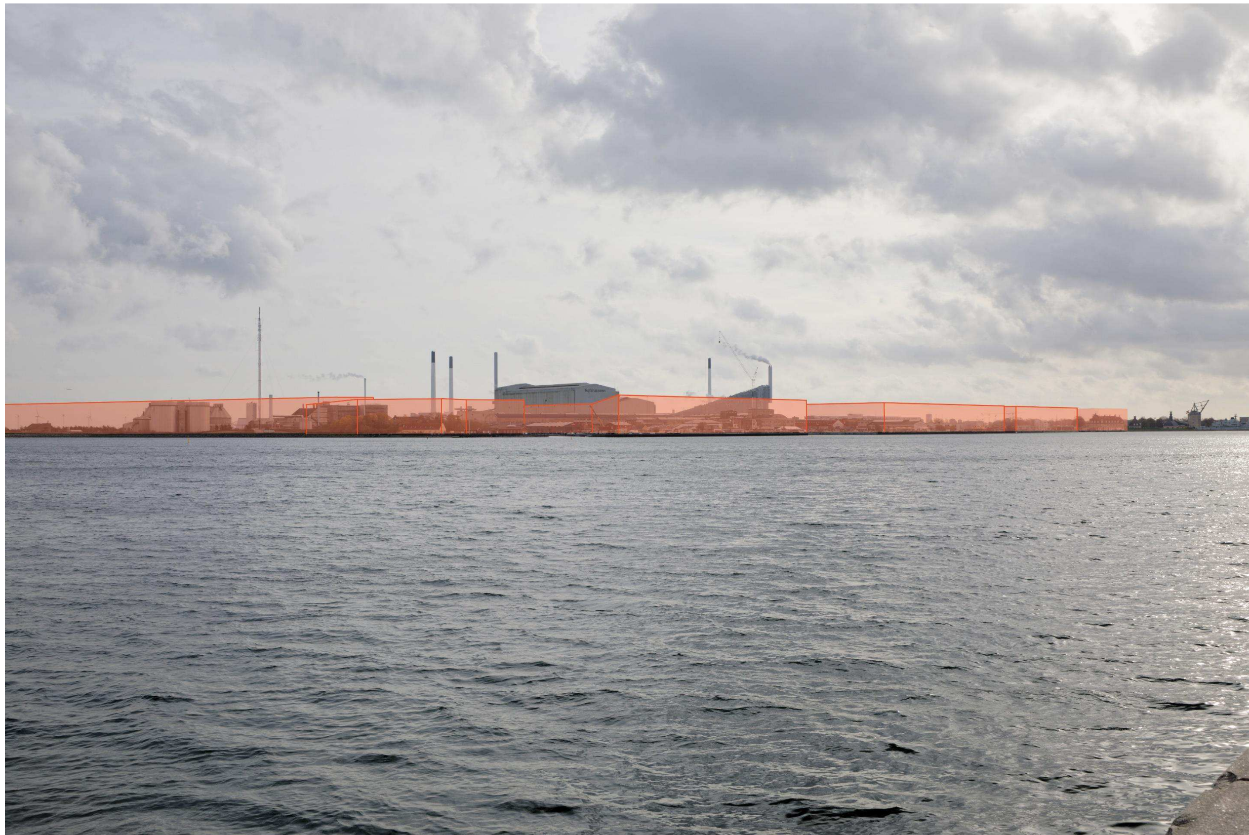
Figur 11 Fotostandpunkt 3 sydøst – fremtidige forhold set fra Langelinie. Til venstre ses en diagrammatisk angivelse af fremtidig bydannelse på Lynetteholm, hvor der til højre er angivet en bydannelse på Refshaleøen. Her vises det sekundære scenariet hvor de arealer hvor Renseanlægget BIOFOS ligger i dag, byudvikles sammen med de resterende arealer på Refshaleøen. Sektionshallen på Refshaleøen, samt ARC placeret på Quintus, fremstår fortsat som de dominerende bygningsværker fra fotostandpunktet.