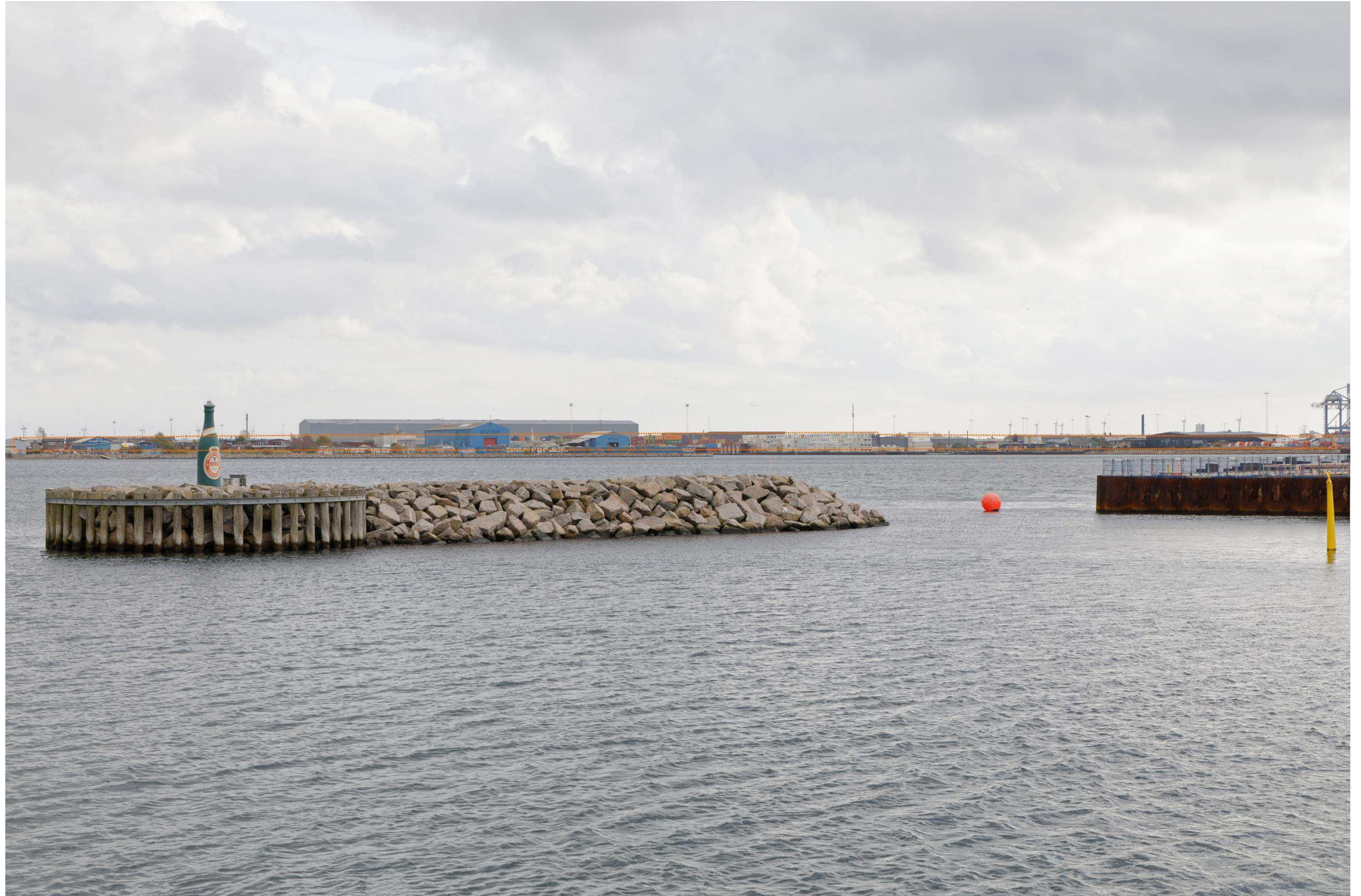
Figur 4 Fotostandpunkt 1 sydøst – fremtidige forhold set fra Gentofte Kommune, Tuborg Havn, hvor den orange priksignatur angiver den fremtidige bydannelse på Lynetteholm. Nordhavn er beliggende i forgrunden og vises som et foto fra 2020. Der er dog en forventning om at byudvikle Nordhavn over de næste 30 år, hvilket vil være med til at påvirke udsynet fra fotostandpunktet.