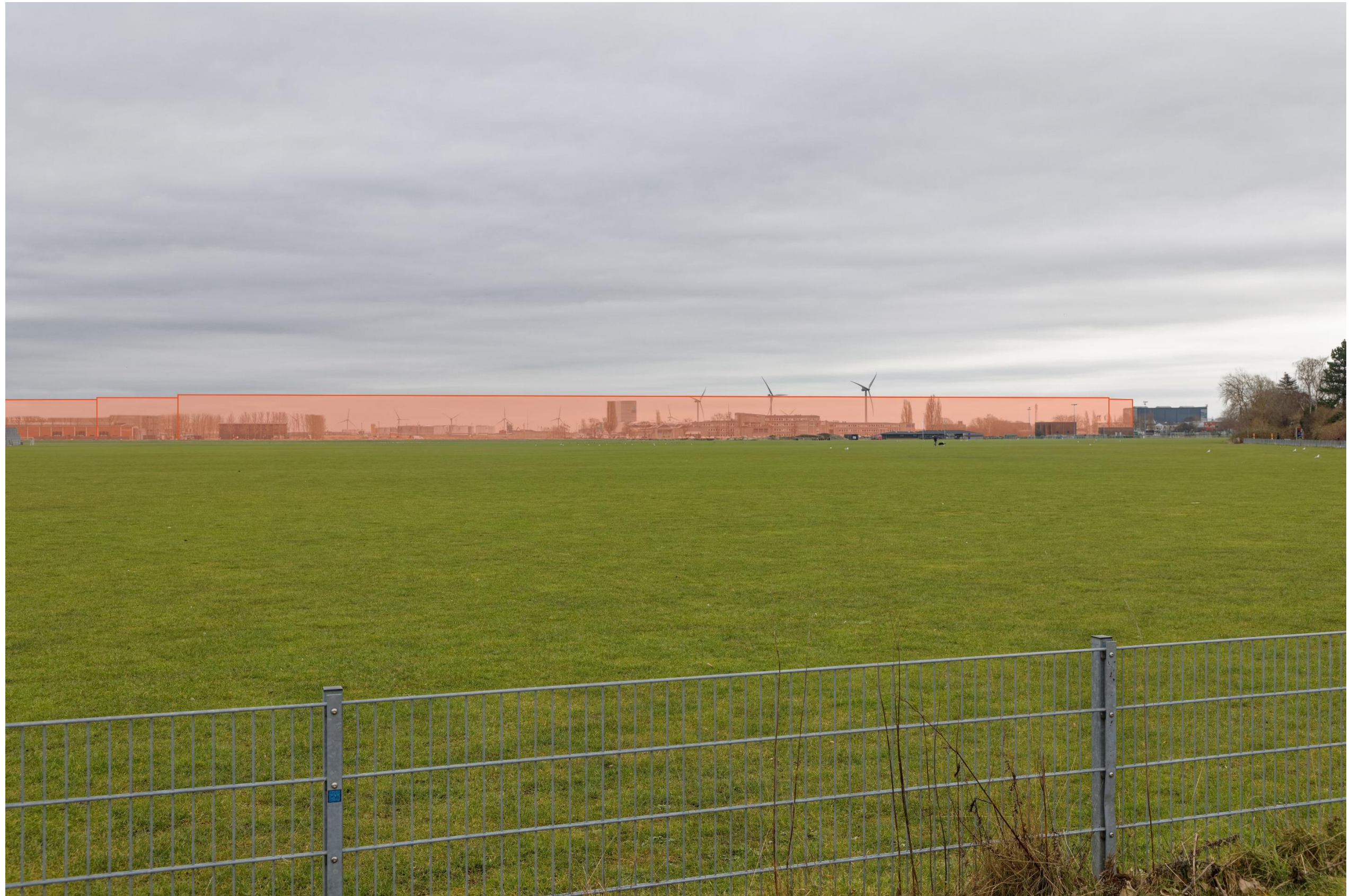
Figur 29 Fotostandpunkt 8 øst - fremtidige forhold set fra Kløvermarken. Kløverparken grænser op til kanten af det grønne areal, Kløvermarken. Viewet fra fotostandpunktet vil ændres markant ift. områdets eksisterende skala og rumlige afgrænsning. Til højre i forgrunden ses HOFORs tekniske anlæg, der ikke indgår som en del af den sammenhængende bydannelse på Kløverparken