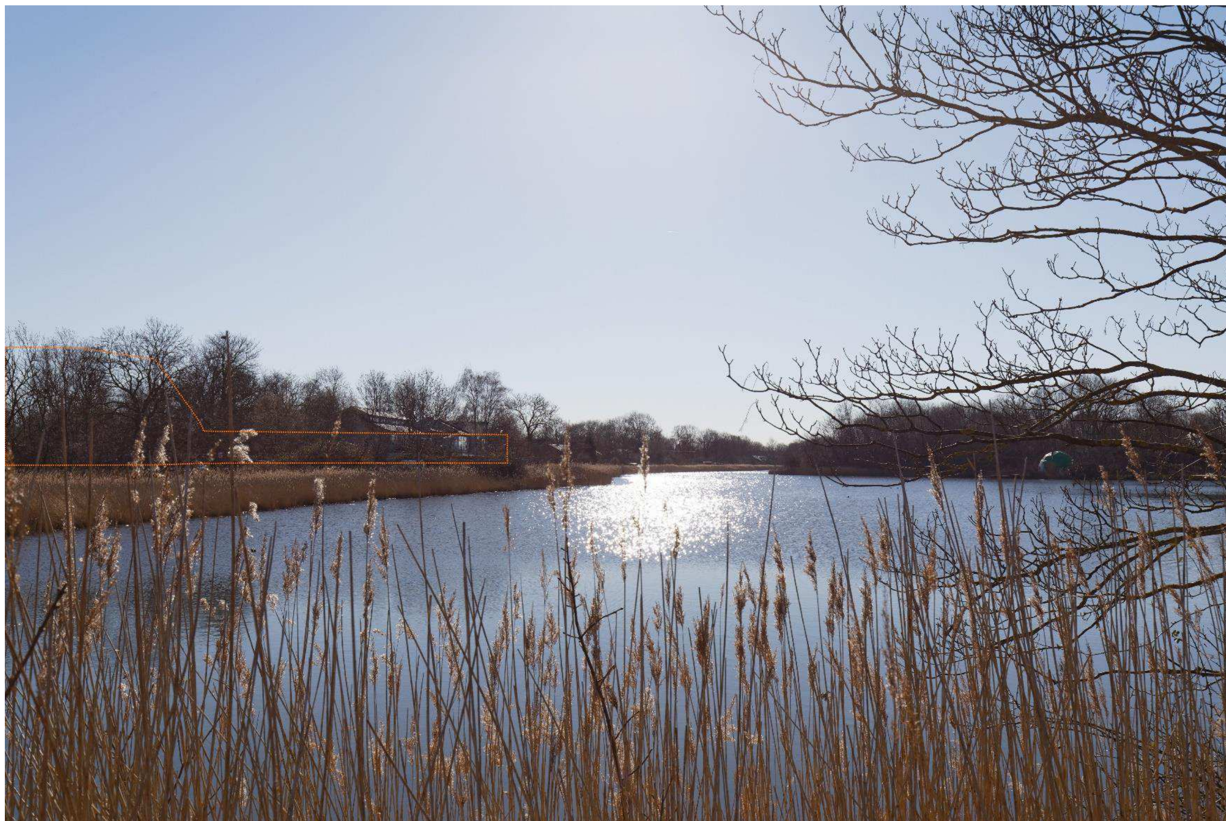
Figur 23 Fotostandpunkt 6 sydøst - fremtidige forhold set fra Christianshavns vold. Længst til venstre angiver den orange priksignatur fremtidig bydannelse på Quintus. I forlængelse her af er der ved samme priksignatur angivet en fremtidig bydannelse på Kløverparken. Kløverparken fremstår lavere end Quintus, da Kløverparken er beliggende længere væk fra fotostandpunktet. De nye bydannelser vil kunne anes gennem løvhænet på bevoksningen til venstre på skitsen. Dette særlig tydeligt i vinterhalvåret hvor bevoksningen fremstår uden blade.