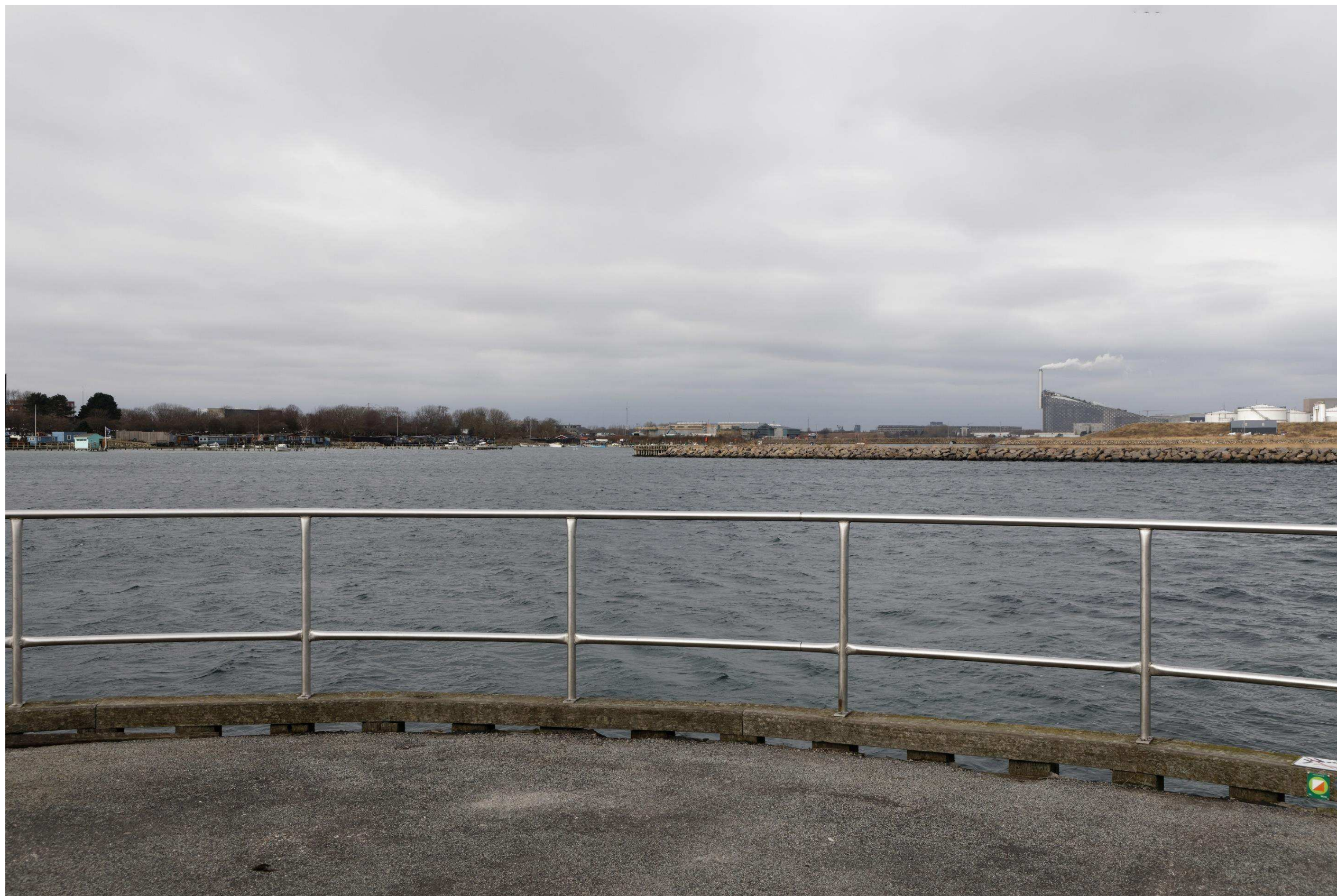
Figur 33 og 34 Fotostandpunkt 9 nordvest – eksisterende forhold og 0-alternativ set fra Amager Strandpark. 0-alternativet er tilsvarende de eksisterende forhold, da hverken Nordhavn eller Lynetteholm kan ses fra fotostandpunktet. 0-alternativet viser udsynet fra fotostandpunktet, hvis planen ikke gennemføres.