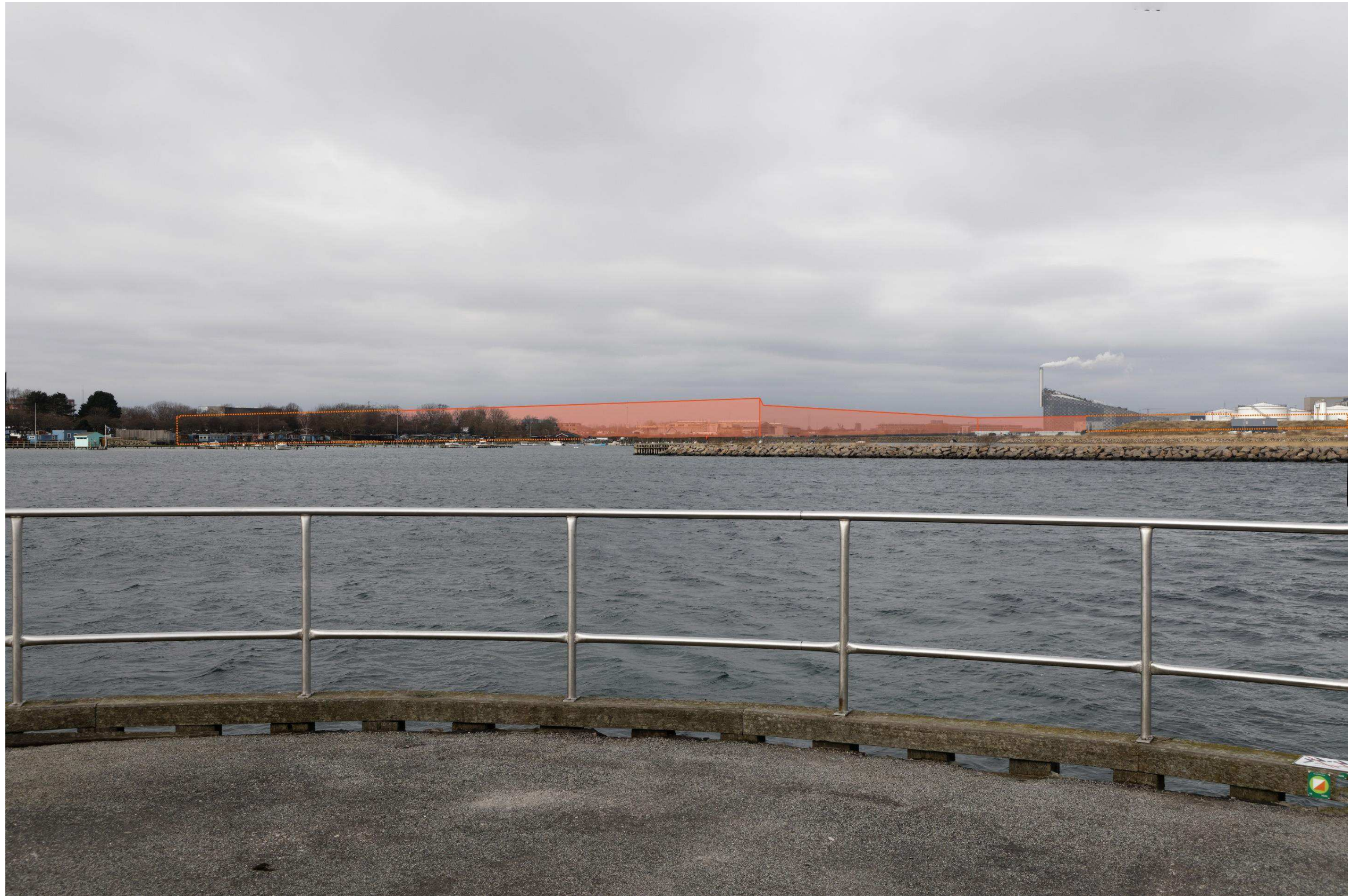
Figur 35 Fotostandpunkt 9 nordvest – fremtidige forhold set fra Amager Strandpark. Til venstre i viewet er Haveforeningen Amager Strand. Bagved bevoksningen vises konturen af en fremtidig bydannelse på Kløverparken og Quintus (placeret nord for Prøvestensbroen), hvor stensætningen på Prøvestenen ses i forgrunden. Den orange priksignatur længst mod højre på skitsen, angiver bydannelse på Quintus (nord for ARC) der strækker sig længere mod øst.