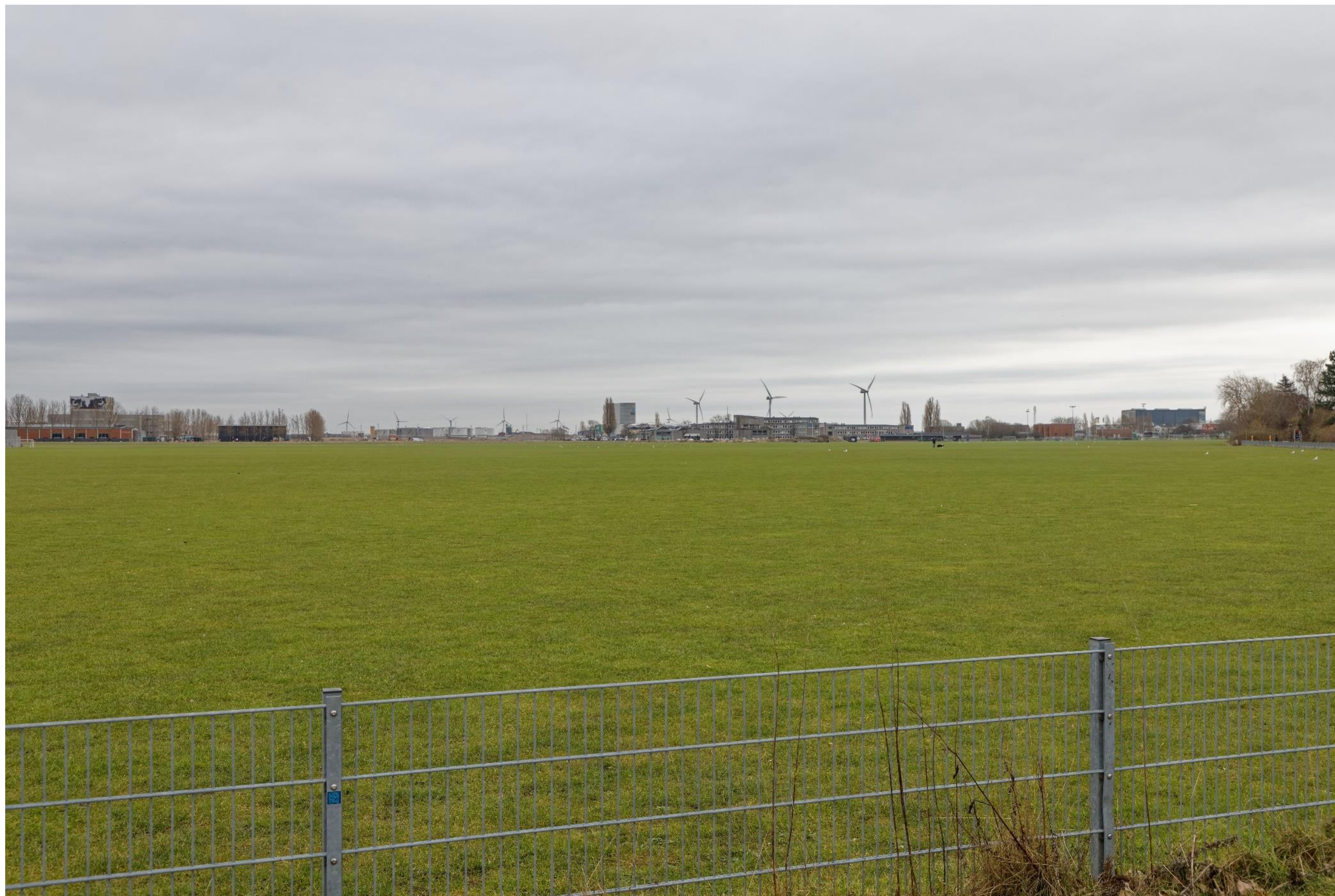
Figur 27 og 28 Fotostandpunkt 8 øst – eksisterende forhold og 0-alternativet set fra Kløvermarken. 0-alternativet er tilsvarende de eksisterende forhold, da hverken Nordhavn eller Lynetteholm kan ses fra fotostandpunktet. 0-alternativet viser udsynet fra fotostandpunktet, hvis planen ikke gennemføres.