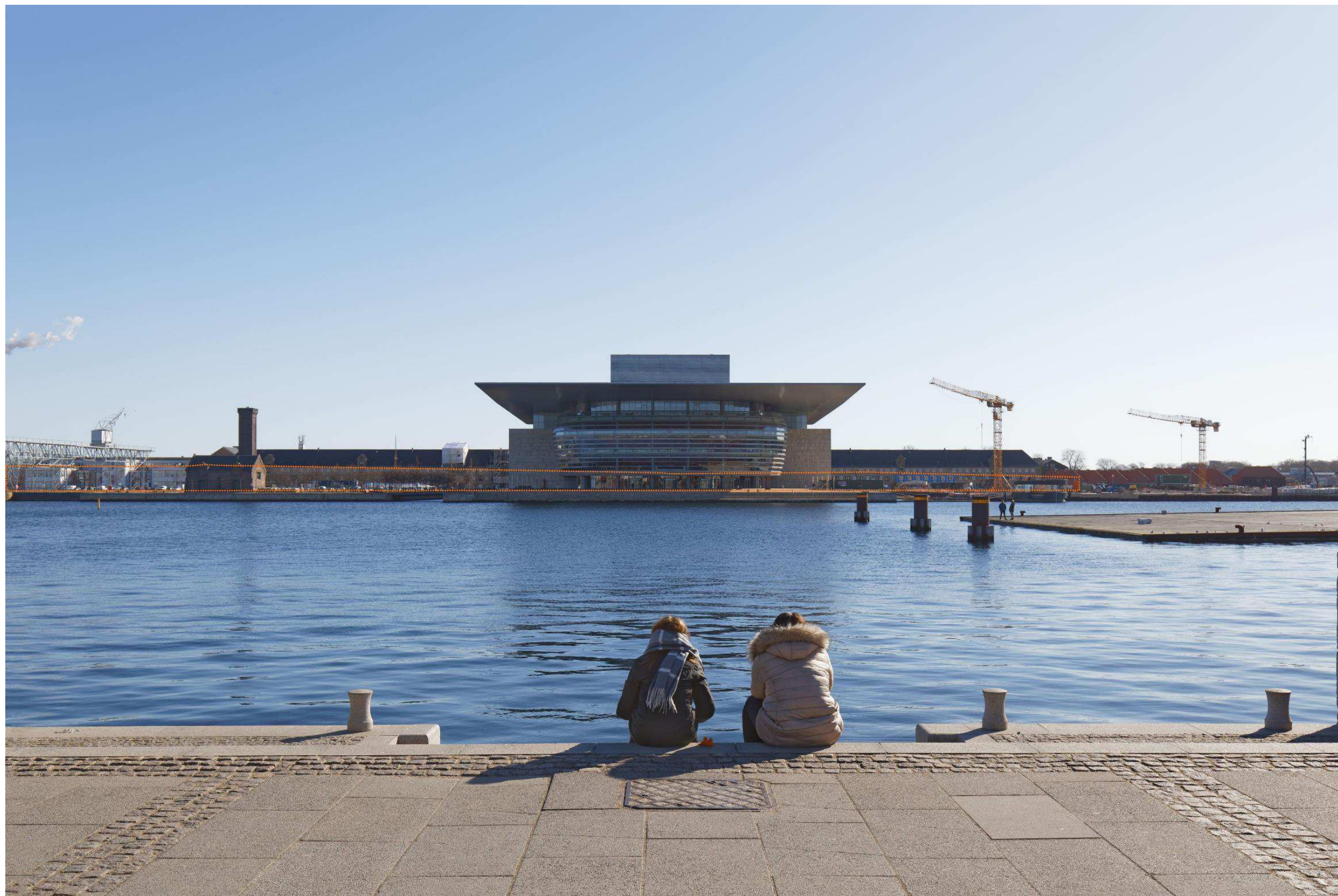
Figur 26 Fotostandpunkt 7 øst - fremtidige forhold set fra Amalienborg sigtelinjen. Den orange priksignatur angiver bydannelse på Quintus og Kløverparken, og angiver dermed hvordan sigtelinjen bliver påvirket. Den fremtidig bydannelse på Quintus og Kløverparken kan ikke ses fra fotostandpunktet, da terrænet, afstanden og den eksisterende by skærmer for synligheden.