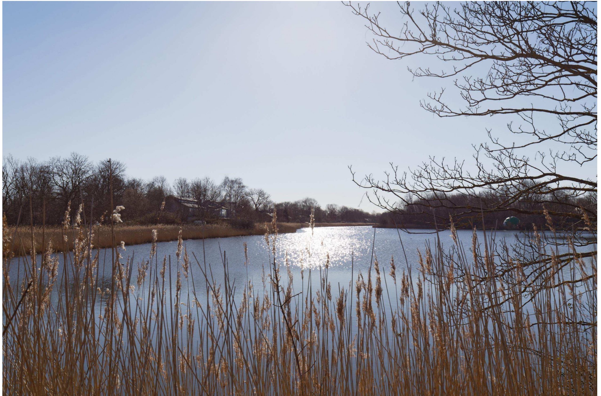
Figur 21 og 22 Fotostandpunkt 6 sydøst – eksisterende forhold og 0-alternativet set fra Christianshavns vold. 0-alternativet er tilsvarende de eksisterende forhold, da hverken Nordhavn eller Lynetteholm kan ses fra fotostandpunktet. 0-alternativet viser udsynet fra fotostandpunktet, hvis planen ikke gennemføres.