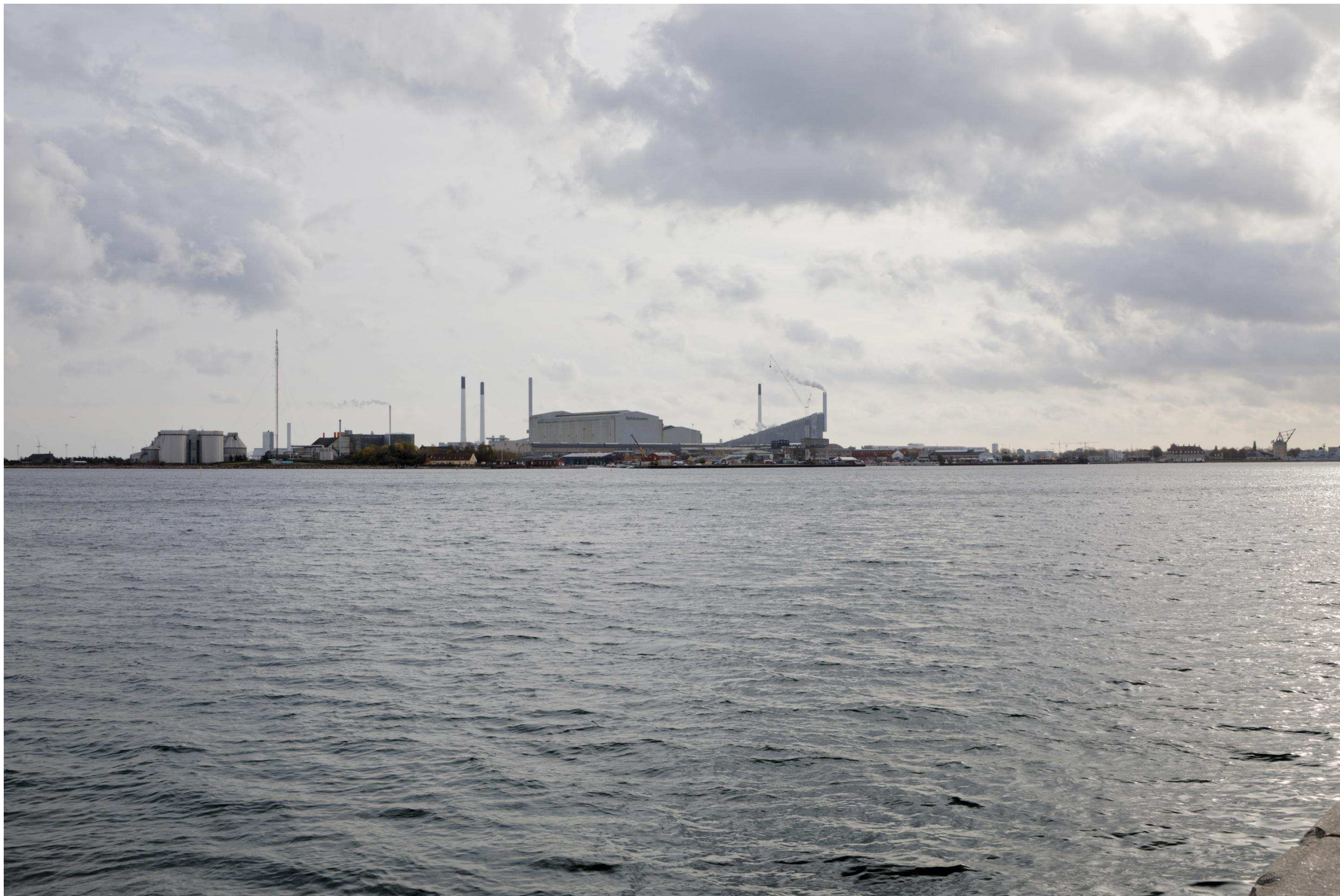
Figur 8 og 9 Fotostandpunkt - 3 sydøst - eksisterende forhold og 0-alternativ set fra Langelinie. 0-alternativet er tilsvarende de eksisterende forhold, da hverken Nordhavn eller Lynetteholm kan ses fra fotostandpunktet. 0-alternativet viser udsynet fra fotostandpunktet, hvis planen ikke gennemføres.