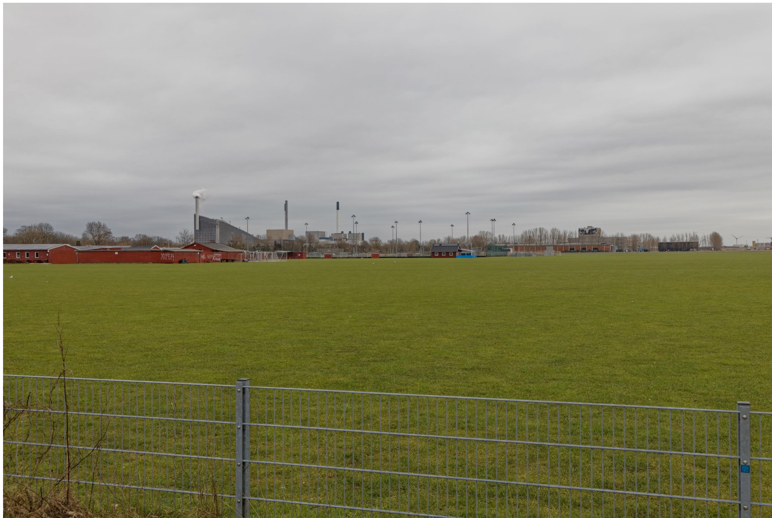
Figur 30 og 31 Fotostandpunkt 8 nordøst – eksisterende forhold og 0-alternativ set fra Kløvermarken. 0-alternativet er tilsvarende de eksisterende forhold, da hverken Nordhavn eller Lynetteholm kan ses fra fotostandpunktet. 0-alternativet viser udsynet fra fotostandpunktet, hvis planen ikke gennemføres.