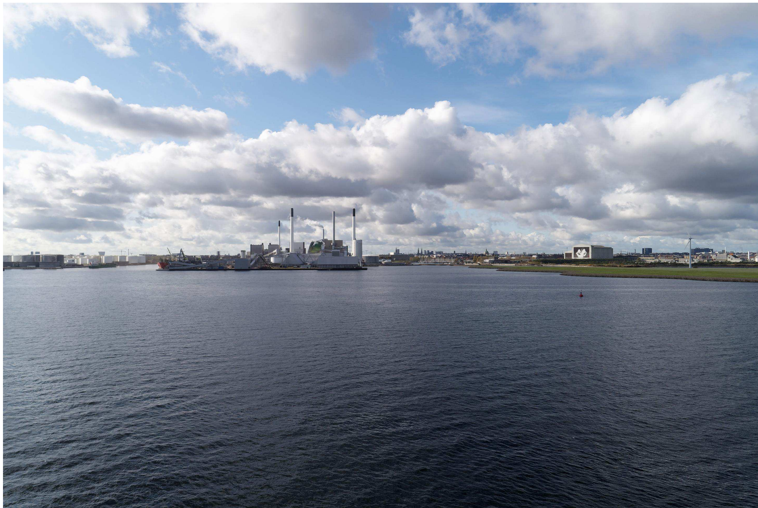
Figur 13 Fotostandpunkt 4 vest-sydvest – 0-alternativ set fra Øresund øst for Lynetteholm. 0-alternativet viser udsynet fra fotostandpunktet hvis planen ikke gennemføres. Lynetteholm er vist i kote 4, jordtransportvejen som etableres mellem Quintus og Refshaleøen, i forbindelse med opfyldet af Lynetteholm fremgår af 0-alternativet.