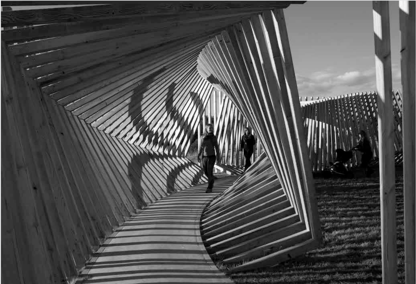
I forbindelse med projektet Vores Kunst, et samarbejde mellem Statens Kunstfond, Statens Kunstråd og DR, har Thilo Frank skabt kunstværket EKKO til Hjøllerup by. Kunstværket italesætter det engagement og den deltagelse, der driver den lille by.