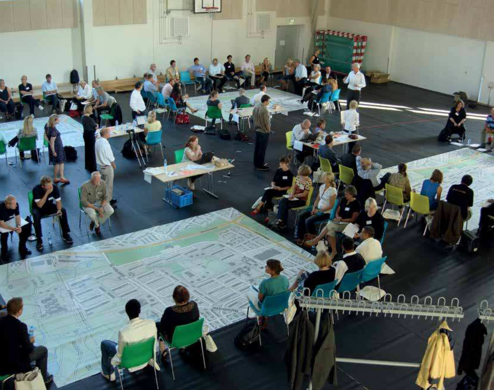
I 2012 vedtog Aarhus Byråd en arkitekturpolitik efter en grundig borgerinddragelsesproces, hvor kommunes borgere, byggeriets parter og erhvervslivet i Aarhus blev inviteret til at deltage i en række forskellige arrangementer.