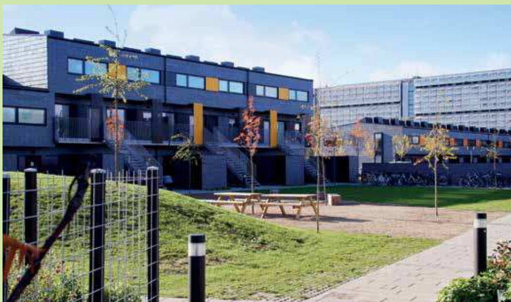
Langhusene i Hvidovre er en del af Almen Bolig+-boligkonceptet, som KAB har udviklet. Huslejen i bebyggelsen er lavere end i traditionelt alment byggeri, fordi beboerne selv skal klare ren- og vedligeholdelse. Langhusene er tegnet af ONV Arkitekter.

Der igangsættes et forsøg med områdefornyelse i Gadehavekvarteret i Høje Tåstrup Kommune, der bl.a. skal sætte fokus på den sociale bæredygtighed i området. Projektet skal således bl.a. skabe bedre sammenhæng mellem byområderne samt mere tryghed og fællesskab i udviklingen af byrum. Gadehavekvarteret er præget af sociale problemer og mangel på byrum og mødesteder. Projektet vil have fokus på bl.a. pejlemærker, planlagte byrum og naturlige mødesteder i det offentlige rum. Forsøget igangsættes af Ministeriet for By, Bolig og Landdistrikter: