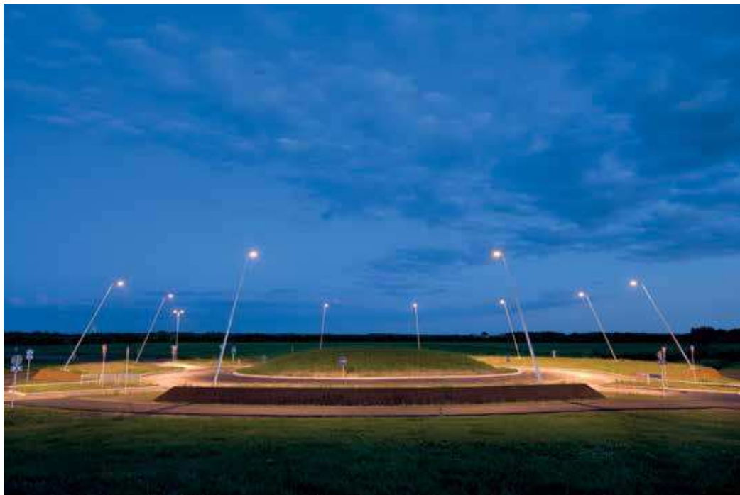
Ved Bramming har Preben Skaarup Landskab tegnet en rundkørsel, der er bygget op som ringe i vandet. Den præcise geometriske form gør anlægget stramt og let overskueligt og bevirker, at trafikanterne kan se, at de kommer til en rundkørsel.