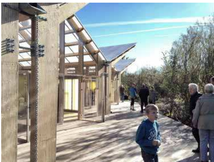
Byg det op – borgerne i byudviklingen var en landsdækkende konkurrence og et tv-program med fokus på midlertidig brug af byens rum til at skabe nye fællesskaber, mødesteder og pladser. Her et projekt i den lille by Fjølstervang, der har fået et – måske verdens første – udeforsamlingshus. Byg det op er udviklet i samarbejde mellem DR og Dansk Arkitektur Center i partnerskab med Realdania, Lokale og Anlægsfondene og Statens Kunstfonds Arkitekturudvalg. Tegnet af Spektrum Arkitekter.