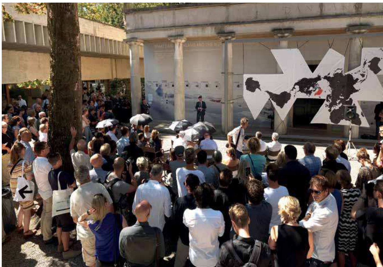
Hvert andet år afholdes den internationale arkitekturbiennale i Venedig. I Arsenale vises hovedudstillingen, der har skiftende internationale kuratorer. I de nationale pavilloner viser landene deres bud på en udstilling, der relaterer sig til biennalens overordnede tema. Her fra den danske pavillon i 2012, hvor udstillingen "Possible Greenland" blev vist.

I forhold til udbud af offentlige opgaver, herunder på byggeområdet, er det blandt andet regeringens målsætning at indføre regelforklaringer for udbud og tilbudsgivning, der kan gøre det lettere for både bygherrer og rådgivere m.fl. at henholdsvis udbyde og give