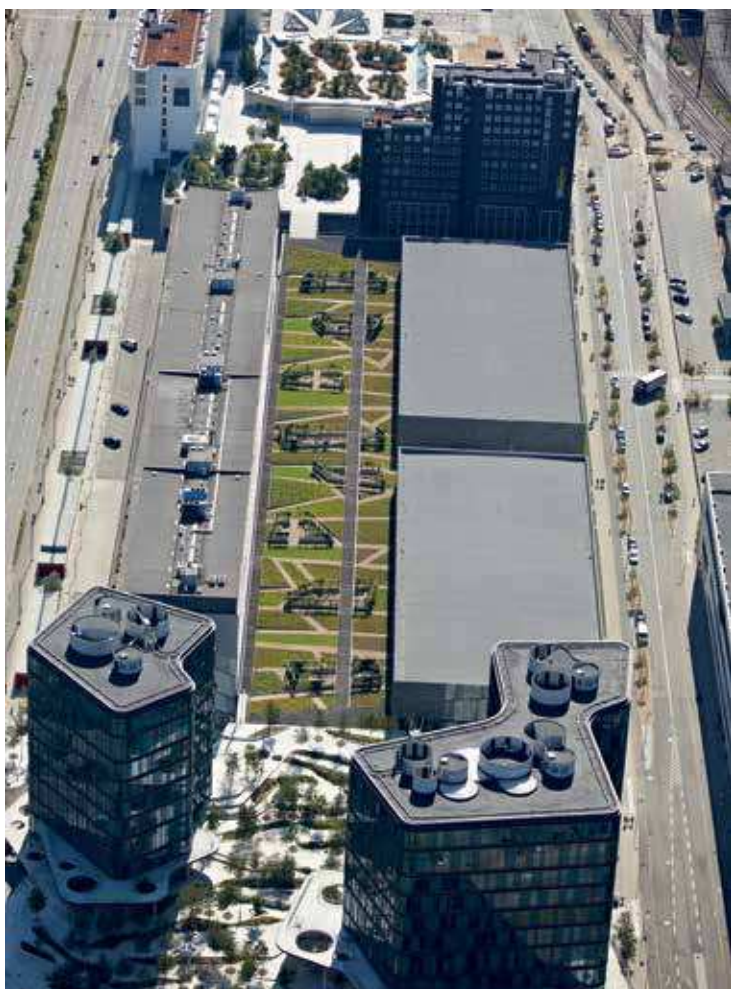
Grønne tage fungerer som en eng og kan optage 60-80 % af årsnedbøren. De optager, fordampner og forsinker regnvandet og aflaster derved kloakker og spildevandsanlæg for store mængder vand, hvilket i sidste ende forhindrer overløb og vand i gaderne. Her Rigsarkivets grønne tag tegnet af Schönerr A/S.