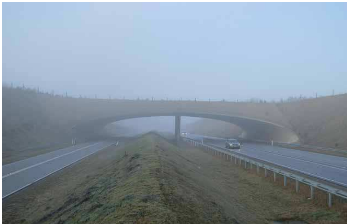
Ved anlæg og udformning af motorveje tager Vejdirektoratet arkitektoniske hensyn på linje med tekniske og funktionelle hensyn. Det gælder f.eks. markante visuelle elementer som broer, støjskærme, vejdstyr og beplantning. Her er det en fauna- og stipassage, tegnet af Bystrup Arkitekter. Foto: Bystrup Arkitekter