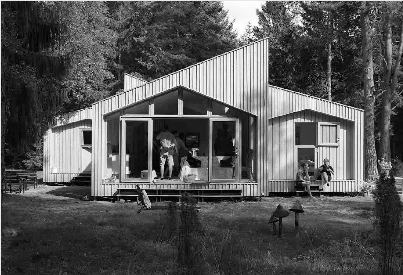
Sommerhuset i Asserbo er Danmarks første CNC-fræsede hus, hvilket i princippet er et printet hus. Huset er tegnet på computer, og derefter er tegningerne blevet 'udskrevet' på en fræser i krydsfinerplader. Pladerne er nummereret og efterfølgende samlet. Huset er tegnet af arkitektvirksomheden EENTILEEN.