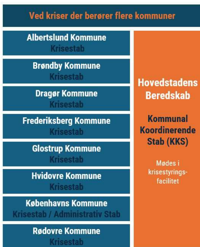
Figur 4. HBR tværgående beredskabsorganisation

Kommunal koordinerende beredskab ledes af en stabschef fra HBR, og staben mødes i HBR's krisestyingsfacilitet. Adresser og lokaler fremgår af delplaner.