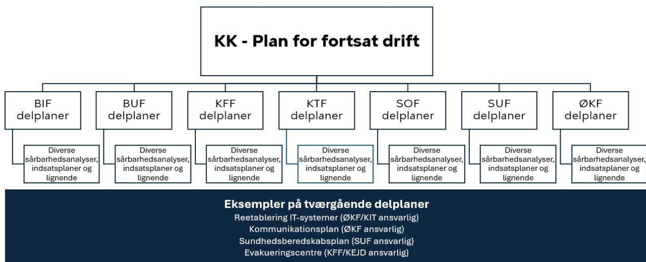
Figur 1. Planhierarki i Københavns Kommune