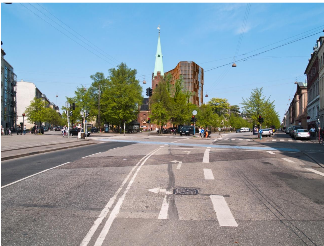
(Fig. 7.1.4) Set fra Hans Torv rejser laboratoriebygningen sig bag Sankt Johannes Kirke mellem denne og det eksisterende Panum-kompleks. Bygningen vender sin smalleste side ud mod torvet.