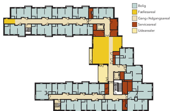
Funktionsdiagram for boligetagerne (1. - 4. sal).