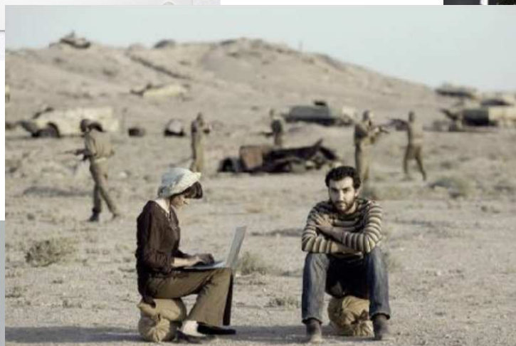
Barakeh, "Untitled Images – Repetitive Patterns, 2014