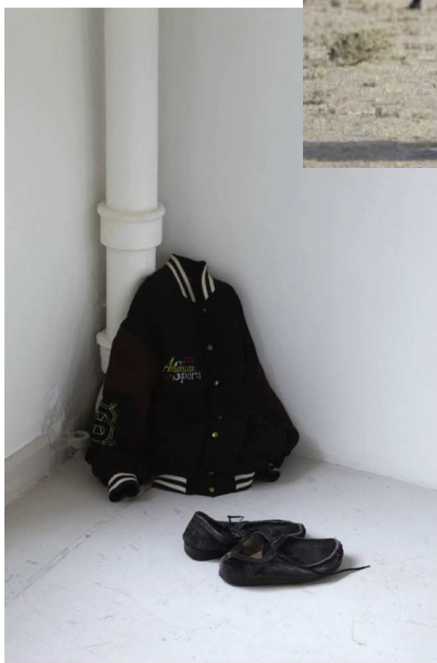
Ibrahimovic, "My Refugee Shoes and My Refugee Clothes", 1999