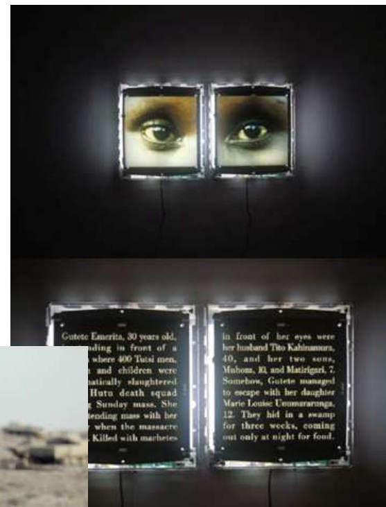
Jaar, "The Rwanda Project: 1994-1998", 1998-