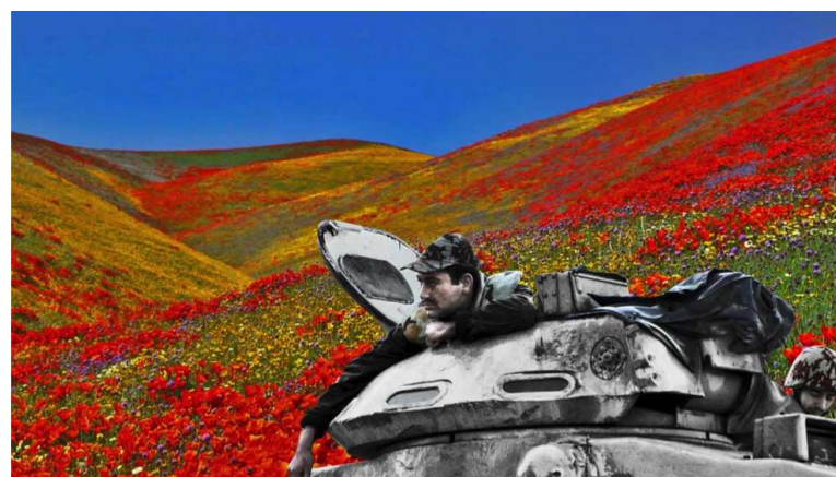
Hammam, "Upekkha", 2011