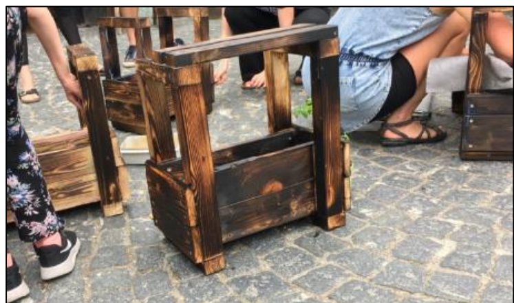
Upcycling workshop med genbrugstræ