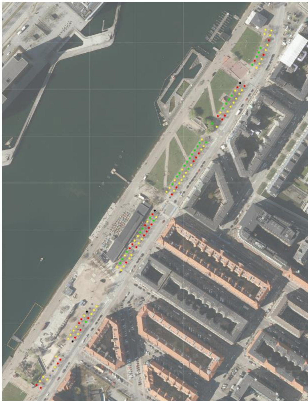
Havneparken, Islands Brygge Kort over træernes forventede restlevetid