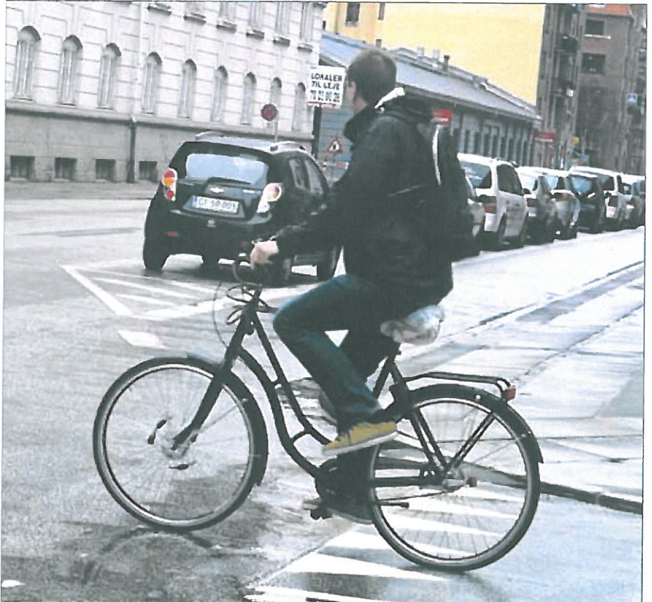
Isafjordsgades udmunding i Njalsgade er en sort plet på sikkerheden for de tohjulede. Cyklisterne har ingen mulighed for at se, om der er fri bane ved venstresving.