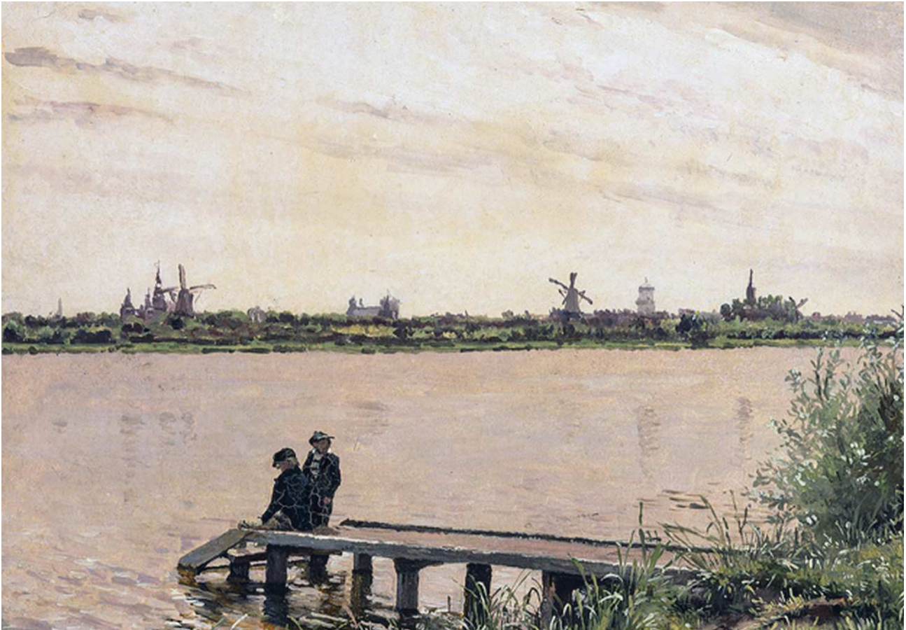
Udsigt til København set fra Sortedamsdosseringen ca. 1837. Maleri: Christen Købke/Ordrupgaard

og byggerirøveri, men en vældig indånding af frihed og fællesskab. Aum!