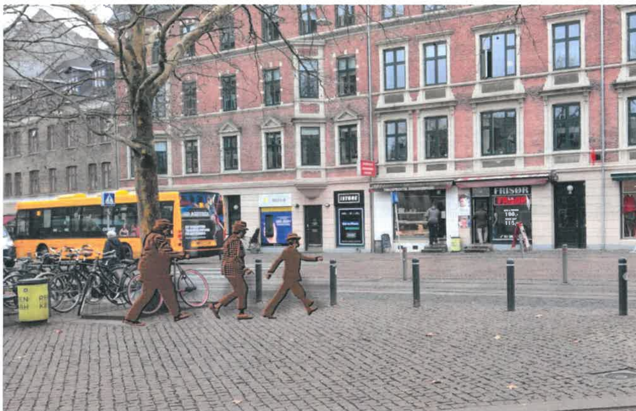
(Simpel visualisering af placeringen på Tingstedet med 30 % drejning mod Mosedalvej)

Et monument i Valbys bymidte, Tingstedet, blot få hundrede meter fra kulisserne i Nordisk Film, hvor man også i 2019 kan besøge den eksklusive Olsen-banden særudstilling, vil være en velfortjent hyldelse til Olsen-banden og seriens filmiske univers, som er blevet dansk folkeeje og del af vores fælles kulturelle arvegods.