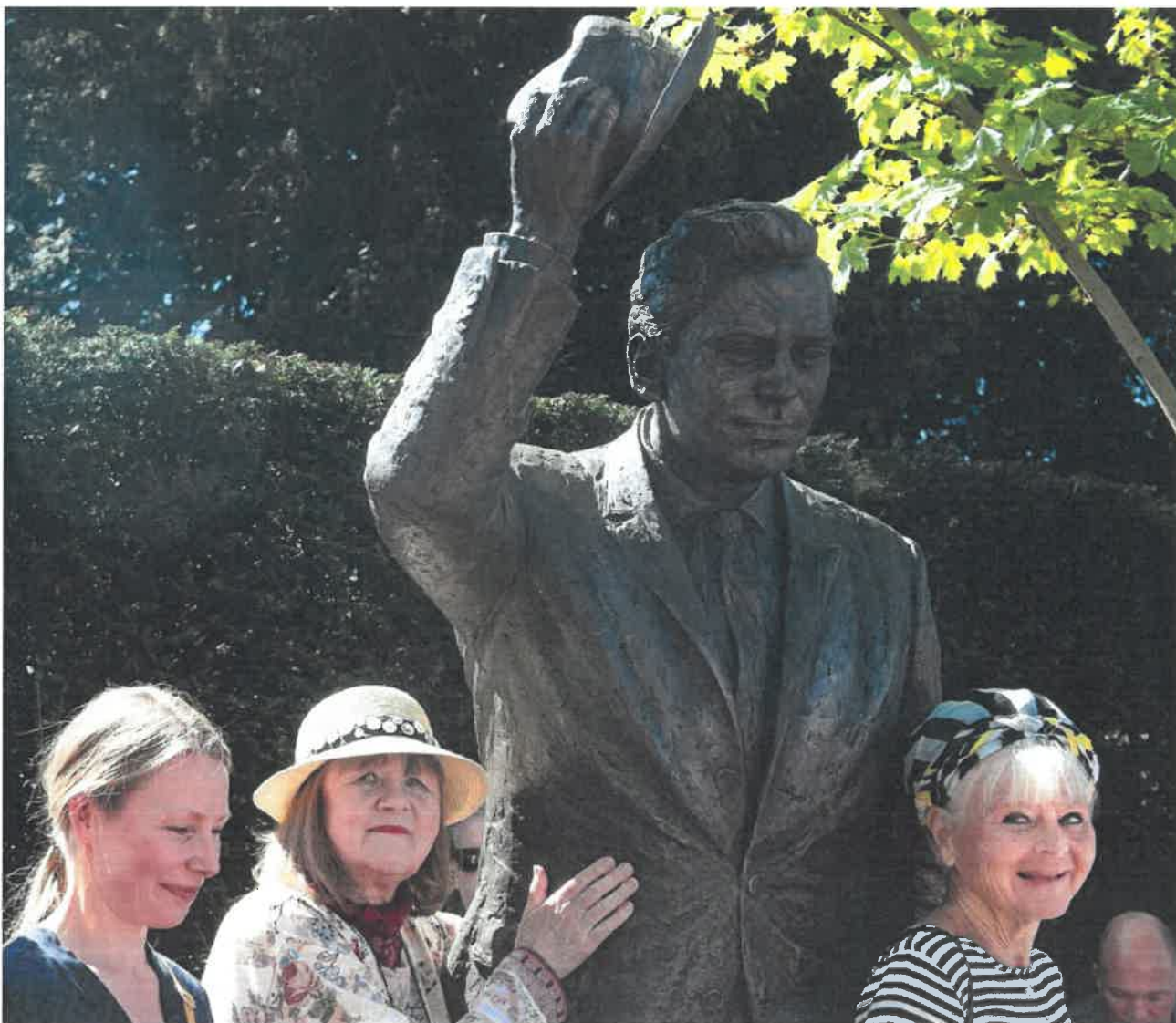
Foto fra afsløringen af Dirch Passer statuen på Frederiksberg d. 6. maj 2018

Med accept fra de afdødes familier og med opbakning fra en række frivillige ildsjæle, Nordisk Film m.fl. ønskes der produceret og opsat en danskproduceret bronzestatue af de 3 forbrydere på Tingstedet i Valby lige ved Nordisk Film og efter helt samme opskrift som den i 2018 afslørede Dirch Passer statue i Alhambra Museets have (tidl. Revymuseet) på Frederiksberg, som blev realiseret af samme gruppe frivillige.