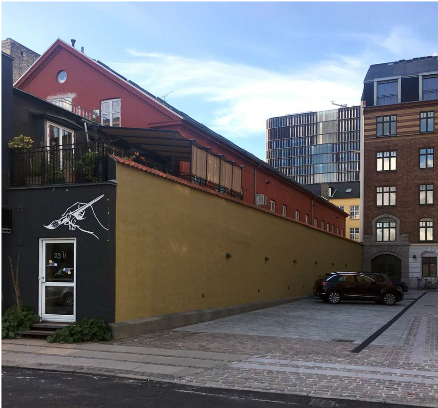
Ryesgade 23 nordøstvendt facade.