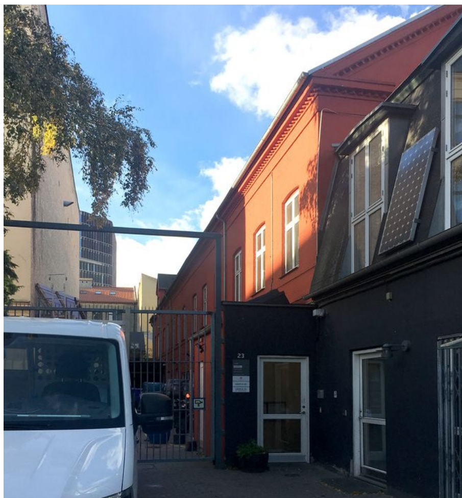
Ryesgade 23 sydvestvendt facade.

Lokalplanområdet er velbeliggende i forhold til kollektiv transport. Området ligger cirka 200 meter fra krydset mellem Blegdamsvej og Fredensgade/Tagensvej, hvor der er busforbindelser til både ydre Nørrebro, Nordhavn, Vesterbro og Indre By. Derudover ligger Nørreport Station omkring 1,5 km væk. Sortedam Dossering er en del af den grønne cykelrute 'Søruten' - der er således også god adgang for cyklister til og gennem området.