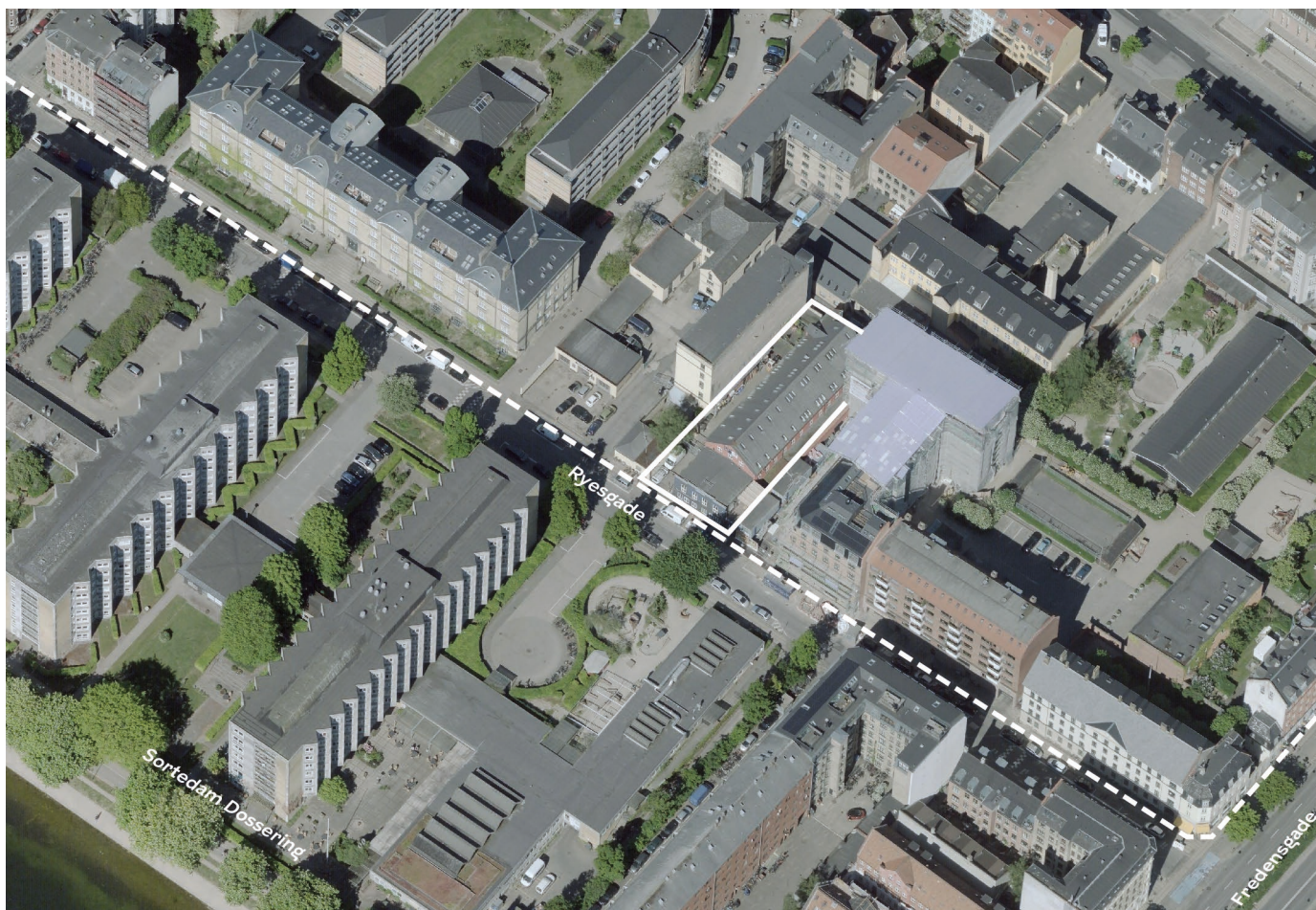
Skråfoto af lokalplanområdet set fra øst. Grænsen for lokalplan 211 er vist med stiplede linje. Grænsen for tillæg 2 til lokalplanen er vist med fuldt optrukket linje.