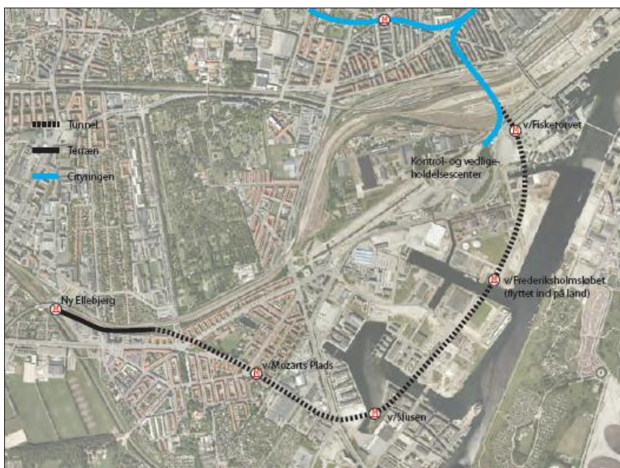
Stationsplaceringer jf. Principaftale om metro til Ny Ellebjerg via Sydhavnen samt udvikling af Nordhavnen.

I henhold til aftalen etableres en metro til Ny Ellebjerg via Sydhavnen med 5 stationer: v/Fisketorvet, v/Frederiksholmsløbet, v/Slusen, Mozarts Plads og Ny Ellebjerg Station. Stationerne etableres som traditionelle dybe stationer, bortset fra metrostationen ved Ny Ellebjerg, der etableres i terræn. Stationsplaceringer og linjeføring fremgår af nedenstående oversigtskort. Udformningen af metro til Ny Ellebjerg via Sydhavn er baseret på rapporten "Udredning af metro til Ny Ellebjerg via Sydhavnen", der er udarbejdet af Metroselskabet i juni 2013.