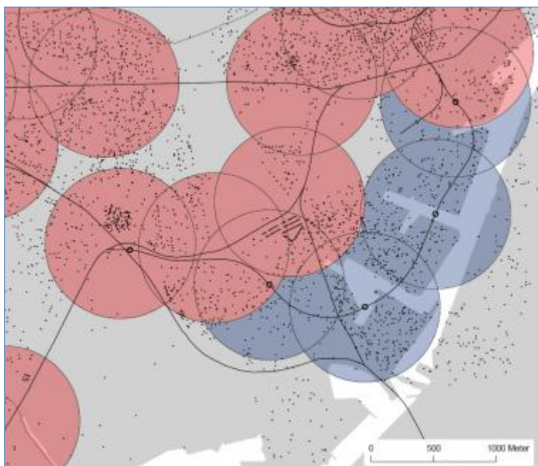
(Udredningen, figur 2.24)

Sjælør-området kan desuden tage S-toget via Ny Ellebjerg Station (2 minutter) eller Hovedbanegården (6-8 minutter), hvor de kan omstige til Metro. Der er således ikke passagergrundlag for at placere en metrostation ved Sjælør Station.