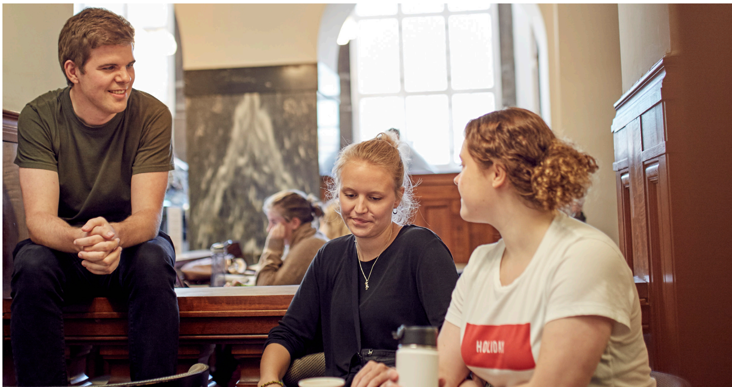
Læsesalen på Det Kongelige Bibliotek i København K