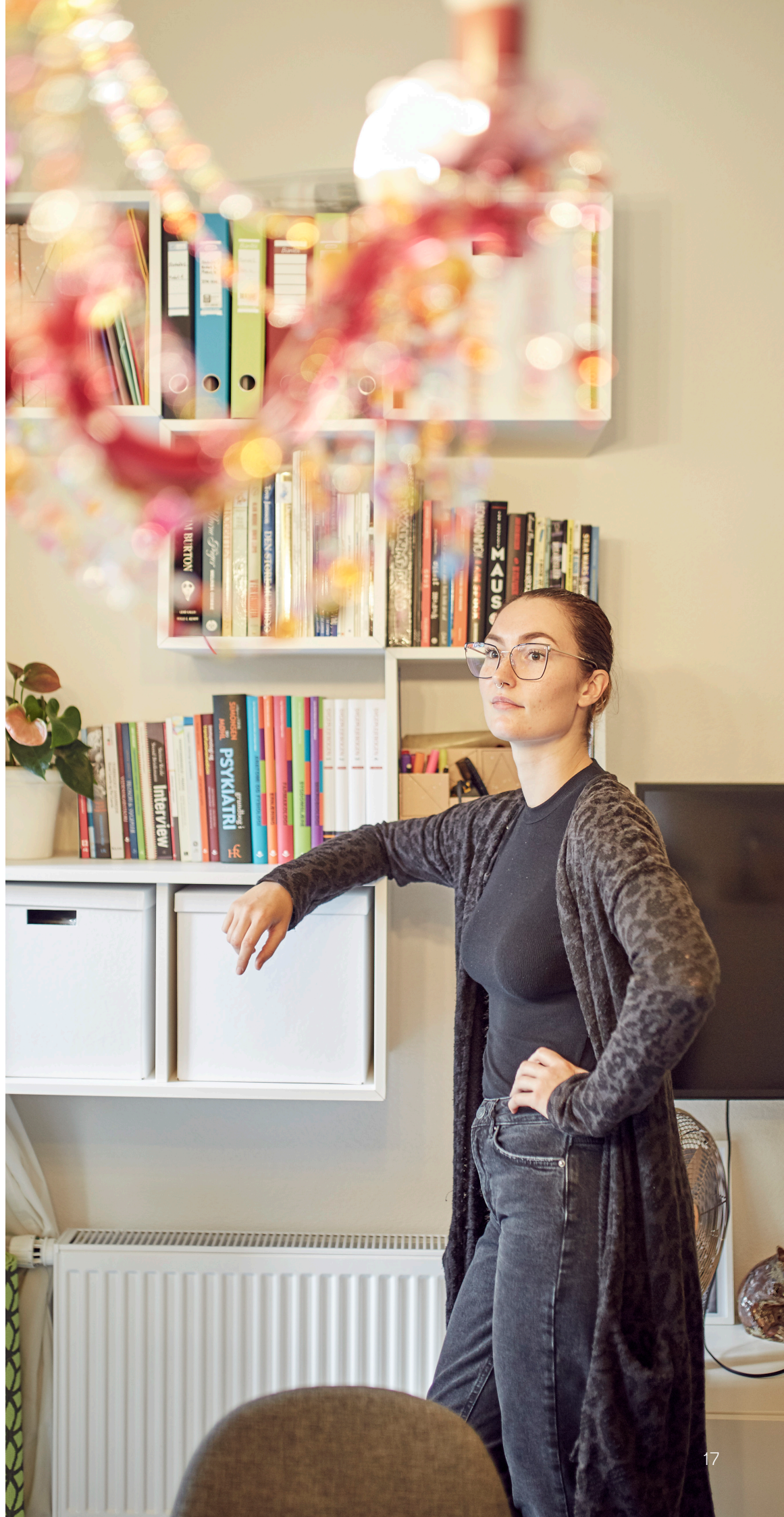
Almen ungdoms- bolig i Samuels Hus på Nørrebro