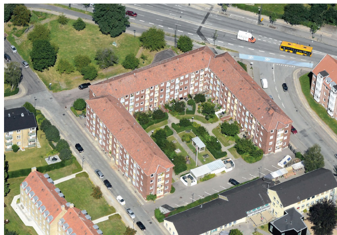
Luftfoto af Sallinghus med kig ind i det grønne gårdrum. Sallingvej ses lige oven for bebyggelsen. Det grønne areal nord for bebyggelsen forvaltes af Københavns Kommune.