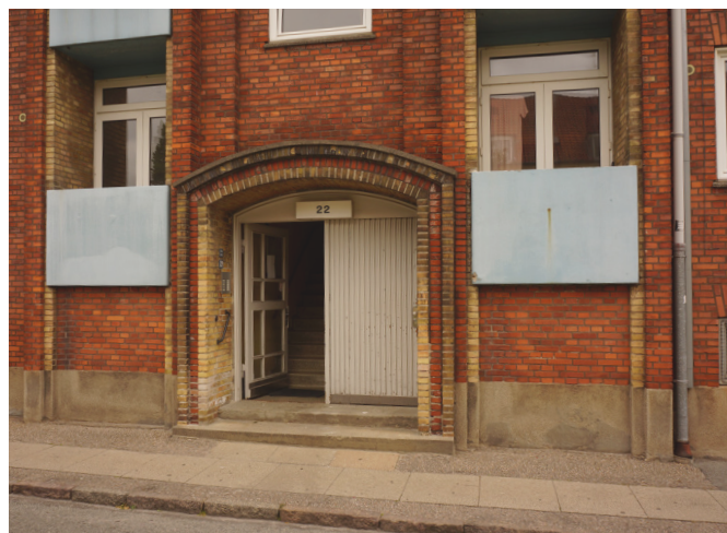
Foto af den eksisterende facade med de oprindelige hoveddøre og fint detaljeret murværk ved indgangspartier og de indeliggende altaner.

Projektet skal leve op til kravene i Miljø i Byggeri og Anlæg 2016 for almene boliger.