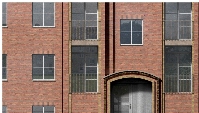
Udsnit af den fremtidige facade. Ved opgangen isoleres indefra for at bevare detaljerne i murværket omkring indgangspartiet. Altanværn udskiftes fra de nuværende lukkede betonværn til åbne værn med tynde, runde stålbalustre. På denne måde lukkes mere dagslys ind i boligerne.